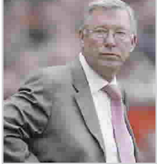
فيرغسون في مهمة صعبة

ديجا / وكالات قال يوسف السركال رئيس مجلس إدارة اتحاد كرة القدم ردا على احتجاج قطر على قرعة بطولة كأس الخليج الـ ١٨ التي ستطلق بالدولة يوم ١٧ كانون الثاني المقبل اذا ثبت أن هناك خطأ قانونيا في عملية إجراء القرعة فنحن على استعداد لاعادتها مرة أخرى.. اما التشكيك في الإجراءات فهذا غير مقبول وأنتمنى أن يكفوا عن التشكيك.. فنحن أبناء دولة الإمارات حالنا مثل حال اخواننا في دول الخليج الأخرى.. فإذا رأوا في أنفسهم النزاهة فيجب أن يروها فينا نحن أيضا.. لقد سبق وشككوا في اختيار العميد فاروق بوظو ممثل الاتحاد الآسيوي وقالوا إن له علاقات طيبة بدولة الإمارات وأنا أقول إننا نرحب بفاروق بوظو وأهلا به في خليجي (١٨) وهو مرشح من قبل الاتحاد الآسيوي وإذا اراد تغييره فسهلا وسهلا وإذا اراد الإبقاء عليه فمرحبا أيضا.. وفاروق بوظو نخر به وبخبراته لأن وجوده يضيف الكثير من النجاحات للبطولة. وتساءل السركال في البطولة الماضية التي أقيمت بالدوحة.. كيف وصلنا لكي نلعب مع قطر في الافتتاح؟ صحيح وقتها كان منتخبنا ضعيفا لكننا على قدر مباريات الافتتاح وقد تعادل قطر معنا بعدما كان منتخبنا متقدما ٢/٠ صفر، فلا ادري لماذا كل هذه الزروعة من ان المنتخبين تقع في مجموعة قطر