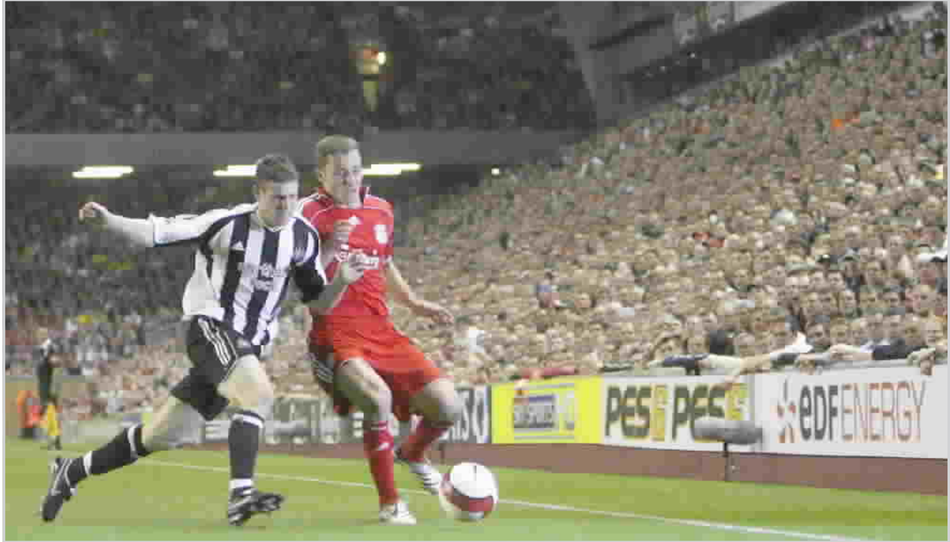
جمهور انفيلد تفاعل مع فوز ليفربول على نيوكاسل (٢-صفر)

بولينا / DPA سيرشح فرانتز بكنباور نفسه مجدداً لرئاسة نادي بايرن ميونيخ الألماني لكرة القدم في الانتخابات التي تجرى في تشرين الثاني المقبل. وقال بكنباور إنه ربما يترشح أيضاً لتولي منصب الرئيس التنفيذي للاتحاد الدولي لكرة القدم (فيفا) في مطلع العام المقبل. وقال بكنباور ٦١ عاماً/ الذي يرأس بايرن ميونيخ منذ عام ١٩٩٤ إنه سيستقيل وقتما يشعر خليفته المعين المدير العام للنادي أولي هونيس بأنه مستعد لتولي الرئاسة. وصرح بكنباور في حفل رعاه بمدينة نورمبرج قائلاً "إنه شيء جيد تماماً أننا الآن نتعاون معاً في أحداث كرة القدم". ويريد الاتحاد الألماني للعبة أيضاً أن يحل بكنباور مكان جيرهارد ماير فورفيلدر (رئيس الاتحاد المنتهية رئاسته) في اللجنة التنفيذية بالفيفا ابتداء من كانون الثاني المقبل. وقال بكنباور "إنني متأكد من أنه يمكنني عمل شيء ما لكرة القدم الألمانية والأوروبية". واعترف بكنباور الذي كان رئيساً للجنة المنظمة لكأس العالم ٢٠٠٦ في ألمانيا بأنه منذ المباراة النهائية لكأس العالم والتي أقيمت في التاسع من تموز الماضي "لم أتمكن من رؤية كرة قدم أخرى". وعاد بكنباور الفائز بكأس العالم عام ١٩٧٤ لاعبا وعام ١٩٩٠ مدرباً إلى استادات كرة القدم للمرة الأولى بعد كأس العالم ٢٠٠٦ يوم الأربعاء الماضي ليتابع المباراة بين هامبورج وأرسنال الإنجليزي في دوري أبطال أوروبا. وقال بكنباور "والآن عادت إثارة كرة القدم مرة أخرى".