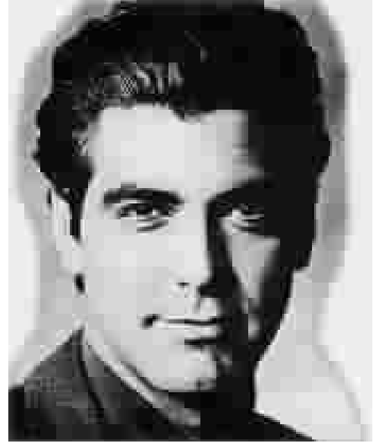
اليمينيون في الولايات المتحدة الأمريكية قالوا انه خائن بسبب مواقفه المعارضة للحرب في العراق

جورج كلوني، يغدو اليوم اقوى الاصوات الليبرالية في هوليوود، كما تقول صحيفة "الانديندنت" في مقابلتها المطولة معه. هكذا يبدو يوم جورج كلوني، ففي نهار اجراء المقابلة معه كان في لوس انجلس، وفي الليل طار الى نيويورك، وفي اليوم التالي عاد الى لوس انجلس ليكمل تصوير فيلمه المقبل "اوشن 11" من اخراج صديقه ستيفن سود بيربيرك. وفي وقت قريب، سيقدم كلوني، فيلماً آخر لسودير بيرك، "الاماني الطبيب" الذي يلعب فيه دور صحفي القي القبض عليه في خلال ، سنوات الحرب الباردة، في برلين بعد الحرب العالمية الثانية مضافاً الى ذلك فيلم آخر في الطريق وهو (مايكل