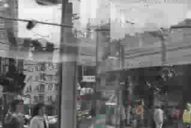
أحد شوارع العاصمة البلغارية .. صوفيا

وحذر رئيس الدولة "لا يجب ان نغرق في الاوهام (...). اذ سيكون على رومانيا ان تقطع طريقا طويلا بين تاريخ انضمامها الى الاتحاد الأوروبي وموعد اندماجها الفعلي في هذه العائلة".