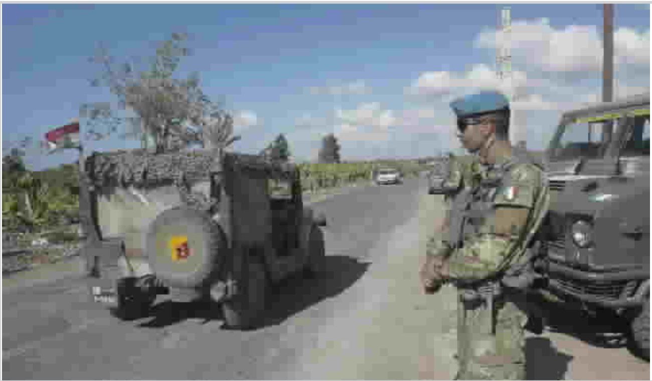
استمرار انتشار قوات اليونيفيل في لبنان

ومراقبة الحدود السورية يشكلا انتهاكا لقرار مجلس الامن رقم ١٧٠١ الذي وضع الشهر الماضي حدا لشهر من المعارك. واعتبر بيريتس انه ليس على اسرايل في هذه الظروف احترام المجال الجوي اللبناني كما ينص القرار.