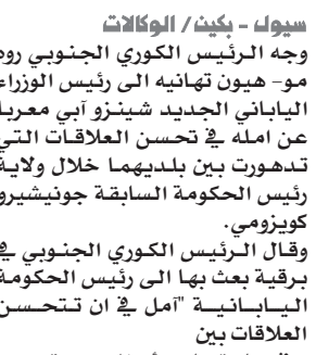
شينزو أبي رئيس الوزراء الياباني

وجه الرئيس الكوري الجنوبي روه مو- هيون تهانيه الى رئيس الوزراء الياباني الجديد شينزو أبي معربا عن اماله في تحسن العلاقات التي تدهورت بين بلديهما خلال ولاية رئيس الحكومة السابقة جونيشيرو كوزوموي.