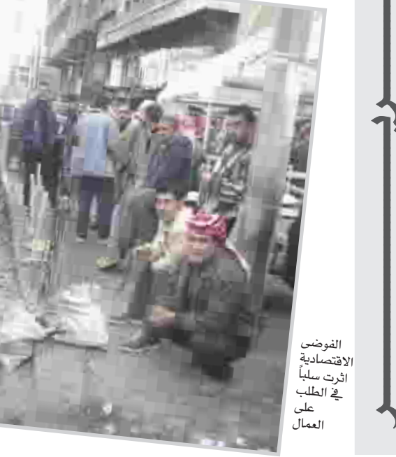
الفوضى الاقتصادية أثرت سلباً في الطلب على العمال

عمال المساطر شريحة واسعة مرهونة ازرقها بالحركة العمرائية، وجدت نفسها تعاني البطالة فاعمال البناء تكاد تكون شبه متوقفة بسبب ارتفاع أسعار المواد الإنشائية والأوضاع الأمنية المتردية والتي من جرائها