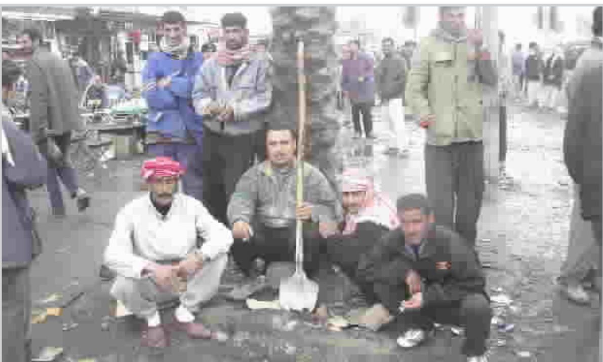
عمال بناء ينتظرون في ما يسمى (المسطر) ان يتم استئجارهم لعمل ما.

فالدوائر المعنية لا تستعين بمراكز التشغيل للماء الشواغر فيها واغلب المواطنين يطمحون للحصول على الوظيفة الدائمة بما فيهم عمال البناء الذين دفعهم الكساد في قطاعهم الى الاتجاه لطلب الوظيفة من هذه المراكز. اما عن القطاع الخاص فالأمور واضحة، فهذا القطاع ولأسباب معروفة توقفت عجلة العمل فيه.