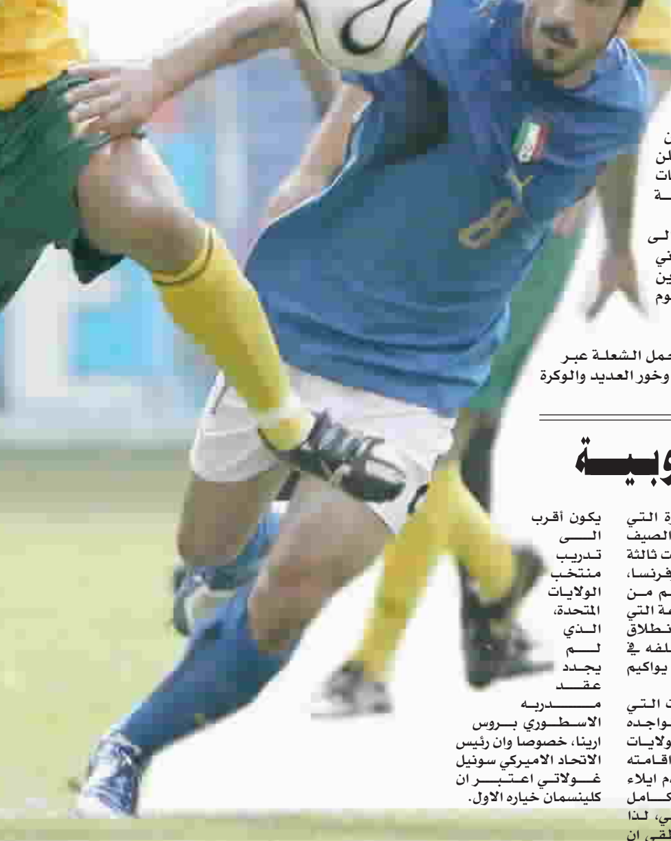
غاتوسو رنة وسط ايطاليا التشيطة

سيفتقد منتخب ايطاليا بطل العالم جهود لاعب وسطه النشط جينارو غاتوسو خلال مباراة يوم غد الاربعاء المقبل امام جورجيا في تبيليسي في الجولة الرابعة من منافسات المجموعة الثانية ضمن التصفيات المؤهلة الى كأس الامم الأوروبية المقررة