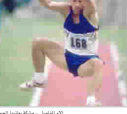
آلام المفاصل .. مشككة بعائنها الجمع

هل هذا يمكننا القيام به؟ تتوجب الذهاب إلى الطبيب، ذلك ان التشخيص والعلاج بصورة مبكرة يساهمان في تقليل اصابة المفاصل بالضرر وتخفيف الالم كذلك، وعند التشخيص السريع سيوحى الطبيب بتركيبة من العلاج قد تشمل على وصفة من مضادات الالتهاب، ومسكنات