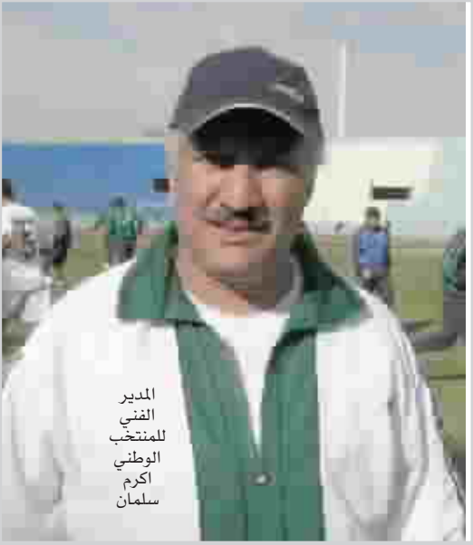
المدير الفني المنتخب الوطني اكرم سلمان

مدينة العين الاماراتية ، يمثل اعتبر المدير الفني لمنتخب الوطني لكرة القدم اكرم احمد سلمان بأن تأهل العراق إلى كأس آسيا السابغ من تموز ٢٠٠٧، والذي تحقق بفضل الفوز بنتيجة ٢-٤ على سنغافورة في المباراة التي جرت على ملعب خليفة بن زايد في