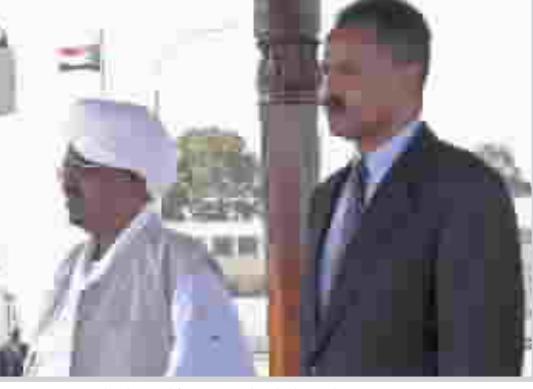
الصراعات العرقية في السودان استنحلت نتيجة الإهمال