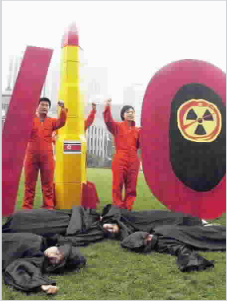
جماعة معارضة للسلح النووي تتظاهر ضد تجربة كوريا الشمالية النووية.