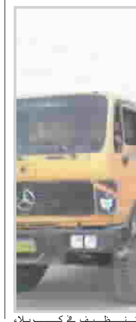
عمليات التنظيف في كربلاء

بغداد / مهدي الصبيح اصعدت مديرية زراعة الديوانية اجتمع مع لجنة تسويق المحاصيل الزراعية في مجلس محافظة الديوانية ضم جميع مدراء الشعب الزراعية تمت من خلاله مناقشة الاستعدادات الجارية لموسم تسويق محصول الشلب في المحافظة، وقد طلب مدير زراعة الديوانية من لجنة التسويق تهيئة الاجواء المناسبة والفلاحين والمزارعين اثناء قيامهم بتسويق المحاصيل الزراعية، خصوصاً توفير الطاقة الكهربائية والوقود