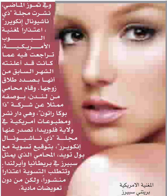
المنية الأمريكية بريتني سبيرز

نيويورك؛ ما زالت نجمة البوب الأمريكية بريتني سبيرز وزوجها كيفن فيديرلاين يتكتمان على اسم مولودهما الجديد، الذي وضعته سبيرز في ١٢ ايلول الماضي، قائلين إنهما ما زالا يبحثان عن اسم له. ولكن تقريراً لشبكة (BBC) أشار إلى أن الزوجين اختارا بالفعل اسماً لابنتهما، وهو جايدن جيمس فيديرلاين، حيث تم الإعلان عن اسم المولود الجديد بعد قيام الزوجين بتعبئة شهادة ميلاده. ولكن أسوشيتد برس، قالت إن سبيرز البالغة من العمر ٢٤ عاماً، وزوجها ٢٨ عاماً، لم يؤكدوا حتى الآن الأنباء التي ترددت حول اسم الطفل. وفي آخر ظهور علني له مساء الخميس الماضي، رفض فيديرلاين الإعلان عن اسم الطفل، وقال خلال حفل (CD USA) للصحفيين: "سوف أترك ذلك لزوجتي لإعلانه". ولم يصل رداً على الفور من ليزلي سلوان زيلنك، مديرة أعمال سبيرز، على رسالة إلكترونية بعثت بها أسوشيتد برس الجمعة، للاستفسار عن اسم الطفل. وكانت تقارير أخرى ترددت وقت ولادة الطفل، أشارت إلى أن الزوجين سيطلقان عليه اسم ستون بيرس، ولكن سرعان ما تراجع تلك التقارير، وقالت إن الطفل سيكون له اسم آخر.