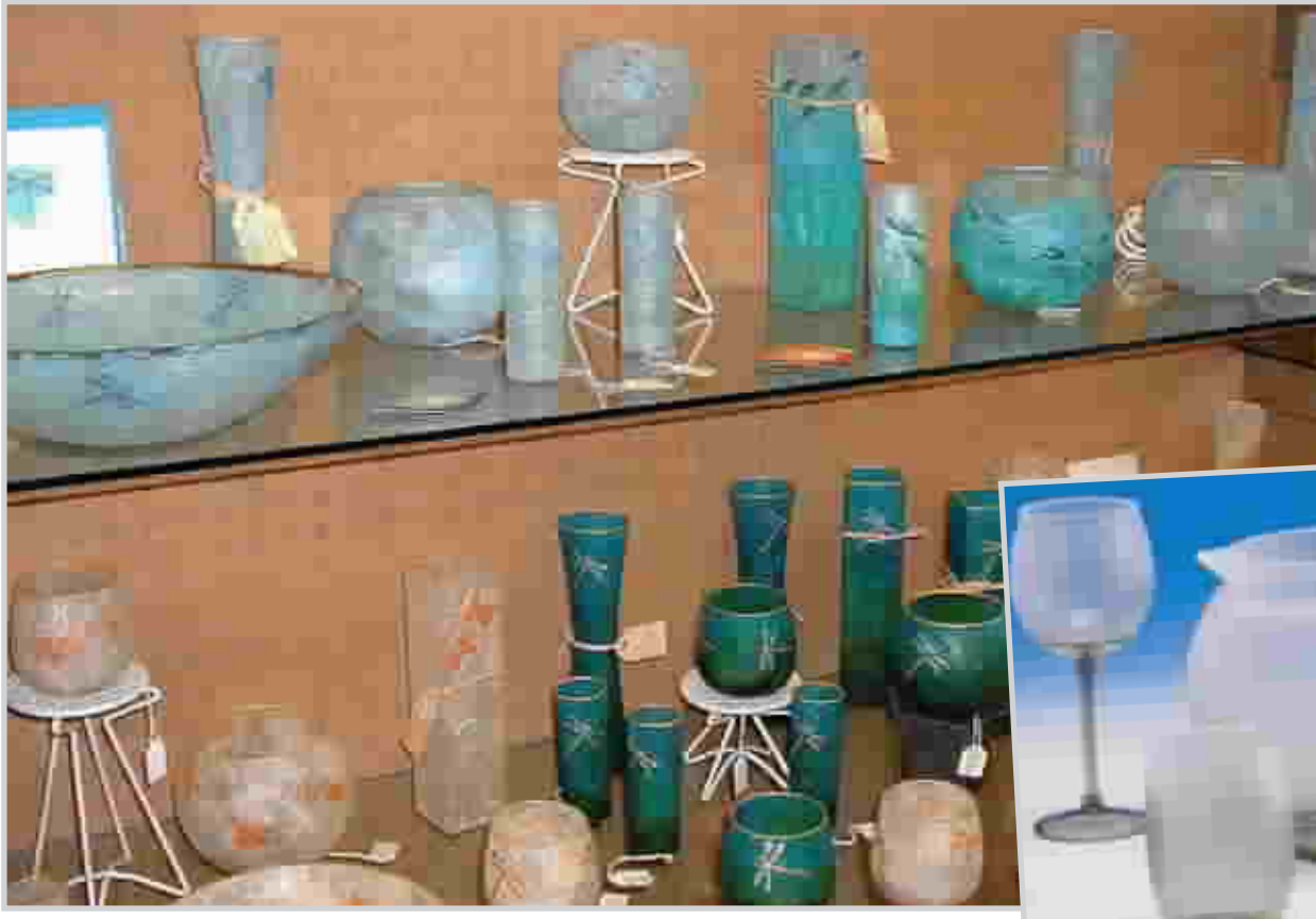
الزجاج دخل في جميع نواحي الحياة

كشفت علماء الآثار للمرة الأولى عن بقايا معمل للزجاج من العصر البرونزي، حيث كان حرفيون ماهرون يصنعون الزجاج من مواد خام. ومن المدهش، أن هذا المعمل، الذي كان ناشطاً حوالي عام ١٢٥٠ قبل الميلاد، هو في مصر وليس في بلاد ما بين النهرين Mesopotamia، التي كان من المعتاد عموماً أنها الأولى في صناعة الزجاج.