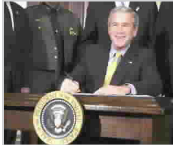
الرئيس الأمريكي جورج دبليو بوش

واشنطن (رويترز)؛ اسم الفيلم (وفاة رئيس DEATH OF A PRESIDENT) وأثارت بدايته الاستفزازية الكثير من الجدل.. لكن ما زال يمكنه إصابة العديد من المشاهدين بالدهشة خلال عرضه الأول في الولايات المتحدة. وقال كتر كاش (٤٤ عاماً) "لم أعرف أن الرئيس سيقبل. كنت اظن انه سيصاب." ويقول تشارلز سنو (٥٥ عاماً) "كنت اظن انه سيدور حول بوش الأب لم أكن أعرف انه عن الرئيس دبليو بوش." ويتخيل الفيلم اغتيال الرئيس جورج دبليو بوش ومطاردة قاتليه الذين يشملون أمريكيين من أصل عربي وجنوداً أسود شارك في حرب العراق. وانتقد عدد كبير متباين من السياسيين من الحزب الجمهوري في تكساس مسقط رأس بوش هيلاري كلينتون عضو مجلس الشيوخ عن ولاية نيويورك وهي من الحزب الديمقراطي الفيلم لتصويره قتل رئيس حالي. وفي دار عرض تبعد سبع بنايات عن البيت الأبيض سخر الجمهور عندما حذر بوش من كوريا الشمالية المسلحة نووياً وضحكوا عندما قال عميل للمخابرات انه لم يتورط في تصرفات عنصرية. لكن ساد الصمت حينما أصيب الرئيس برصاص قناص واستمر الصمت معظم ما تبقى من وقت الفيلم. وبعدها قال العديد من المشاهدين ان عدم حبهم لبوش وسياساته المحافظة هو الذي دفعهم لمشاهدة الفيلم. وقالت ميكي مارتينز (٥٥ عاماً) "كان مضحكاً عندما كانوا يتحدثون عن همي كان