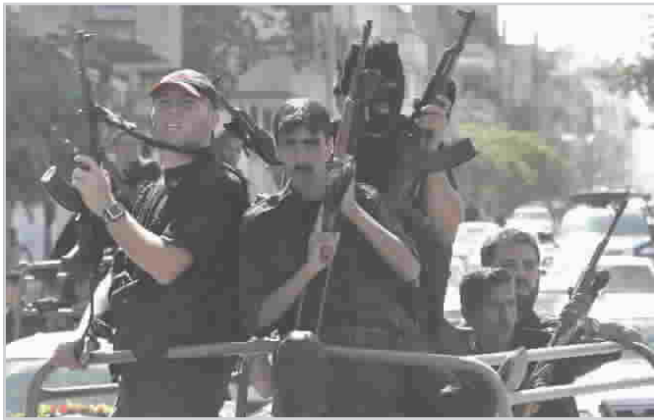
مسلحون فلسطينيون في شوارع غزة

العواصم / وكالات قال رئيس الوزراء الاسرائيلي ايهور اولمرت ان الحكومة قد تقر في الايام القادمة شن هجوم واسع النطاق في قطاع غزة، وذلك وفقا لما ذكرته مصادر برلمانية. وحذر اولمرت في اجتماع للجنة الدفاع والشؤون الخارجية في الكنيست من ان "الجيش يعد لواقعة من العمليات الأوسع نطاقا في قطاع غزة". و اضاف رئيس الوزراء الاسرائيلي ان "الحكومة تنوي اتخاذ قرار بشأن الطبيعة المحددة لهذه العملية في الايام القادمة". الا انه أكد من جديد عدم وجود نية لدى اسرائيل في إعادة احتلال قطاع غزة الذي انسحبت منه العام الماضي. من جانبها وصفت الولايات المتحدة الخطط الاسرائيلية بشن عملية عسكرية واسعة في قطاع غزة بأنها مسألة "دفاع عن النفس" لا يحق سوى لإسرائيل اتخاذ القرارات بشأنها. وردا على سؤال حول تصريحات بشأن العملية في غزة، رفض المتحدث باسم وزارة الخارجية الأميركية شون ماكورماك التعليق على العمليات العسكرية الاسرائيلية، الا انه وضعها في إطار "حق اسرائيل في الدفاع عن النفس". وقال ماكورماك ان اسرائيل "دولة تتمتع بالسيادة، وهي لا تسعى ولا تحتاج الى اذن الولايات المتحدة للتحرك دفاعا عن النفس". و اضاف "نحن لا نعطى ضوءا احمر او برتقاليا او اخضر". وريث ماكورماك التهديدات الاسرائيلية بعملية واسعة النطاق في غزة باحتجاز الجندي الاسرائيلي جلعاد شاليت الذي الفوري لكبح جماح العدوان