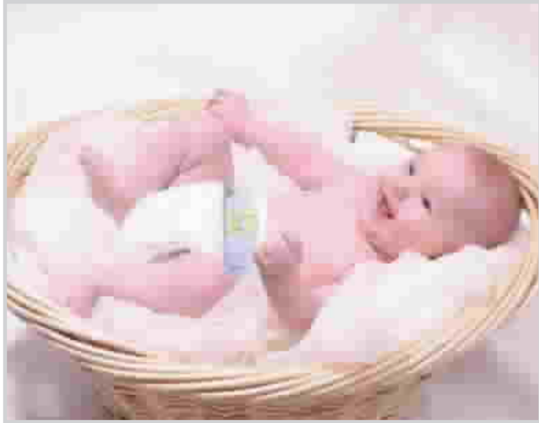
هل يبكي طفلك كثيراً؟

كأنبيوا؛ أفادت دراسة حديثة بأن احتضان الطفل عند البكاء يساعد على نموه عصبياً وعاطفياً. وأشارت الباحثة كارين ثورب من