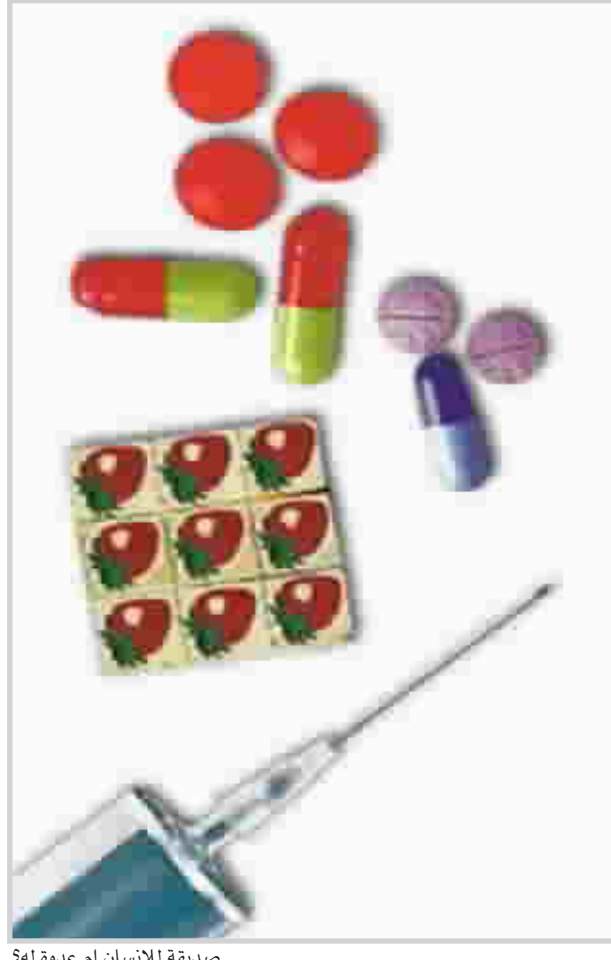
صديقة للانسان ام عدوة له؟

السؤال هو اذا كانت الطبيعة تستخدم كل هذه المعادن على امتداد الملكتين الحيوانية والنباتية، فلماذا لا نستخدمها نحن؟" واليوم، يستثمر العلماء سلسلة من العقاقير التي تحاكي اكثر التأثيرات مرغوبة لمعادن معينة. وهذا اساس جديد للصناعة الصيدلانية، التي يقول اورفيغ انها قد ركزت طويلا على تصميم عقاقير قائمة على جزيئات عضوية، او كاربونية الاساس. ويقول اورفيغ: "هناك إدراك بأن المعادن سمية ويوجه خاص اذا استعملت تعبير معادن ثقيلة، فإن الناس سيتراجعون في حالة هلع.. اعتقد بان شركات الادوية معادية نوعا ما للمعادن، وهو ما يفسر لنا لماذا نرى الكثير من الادوية ذات الاساس المعدني تأتي من شركات اصغر". وبينما تتوفر للمرة في السوبر ماركت كمية وافرة من الاغذية الغنية بالمعادن ليختار منها ما يشاء، فإن تيسر المعادن في المحيط قصة مختلفة جدا وذلك ما سنحدثكم عنه في فرصة اخرى.