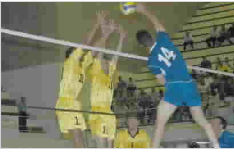
لقطة من منافسات الدوري المحلي لكرة الطائرة

بغداد / هليلك جليلك من المتوقع ان تصل يوم غد الأحد بعثة المنتخب الوطني لكرة الطائرة للمشاركة في البطولة العربية الخامسة عشرة لمنتخبات رجال الكرة الطائرة التي تستقام على صالة مركز الشباب بالجفير في العاصمة البحرينية المنامة خلال الفترة من ١٦ حتى ٢٣ من شهر تشرين الثاني الجاري وسيترأس البعثة نائب