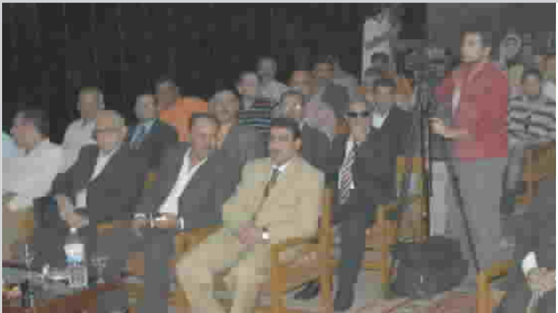
جانب من الحاضرين في المؤتمر