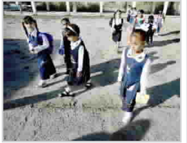
تلاميذ يتوجهون الى مدارسهم

بغداد/ هاجر السعدني تصر بعض المعلمات على انتهاج طريقة في اعطاء الواجبات المدرسية للطلاب والطالبات من المراحل الدراسية الاولى غير معقولة بل اطلاقاً متناسيات الظروف القاسية التي تحيط بالطلبة والطالبات والامهات الى حد سواء والطريقة هذه تكمن في المبالغة في الواجبات الدراسية البيئية التي تتطلب جهداً كبيراً من الاطفال الامر الذي يدفع بهم بمرور الوقت الى الابتعاد عن المدرسة وتمنية روج الكره لها اضافة الى اجبار الطلبة على رسم الاشكال المطبوعة في الكتاب في مادة الرياضيات ومادة العلوم مما يجعل الامهات مشغولات بشكل يومي في تنفيذ ما تريده المعلمة من ابنائهن وبناتهن، ان الاشكال التي يطلب رسمها في