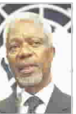
د. ثوبا البرزنجي

جعلكم تسعون لايقافها بجهد فائق، فان الحرب العراقية- العراقية المستمرة منذ اكثر من ثلاث سنوات تستحق منكم جهداً مماثلاً لايقافها فالضحيا هنا يتساقطون بالعشرات يومياً ومشروع المصالحة الوطنية تبعثر ويواجه العقبات بسبب عدم جدية الدعم الدولي لهذا المشروع وانهادهم، وفقدان الوساطة النزوية لجمع الضراء على طاوله واحدة لطمر الخنادق بينهم ومساعدتهم على التفاهم المتبادل، وعلى هذا فنحن ندعو الأمم المتحدة ممثلة بشخصكم المحترم الى بذل جهد خاص لتهيئة مناخ ايقاف هذا النزيف العراقي واعادة اجواء اللحمة