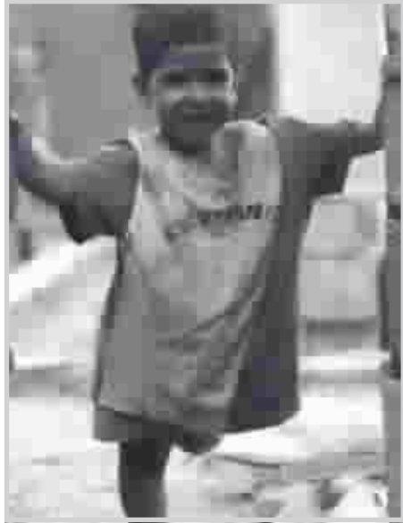
لقطات من عديسته

الجميع تناول الفوتوغراف كلفة موجهة الى المتلقي في الداخل هذا بالإضافة الى العزوف عن متابعة نتائج وتجارب من في الخارج التي ستجعل منه على معرفة ودراية بالكييفية التي يتعامل بها الآخرون والأسلوب الذي يوصل الأفكار من خلال الفوتوغراف. فالفوتوغراف لغة ابداعية عالمية والجمعيات..... بالإضافة الى المؤسسات التي تعنى بهذا الفن هي غير موجودة تبعاً في بلدنا أيضاً وتتحمل جزءاً من مهمة ايبصال الفوتوغراف العراقي الى العالم. الى اي مدى يمكن اذن للمصور العراقي ان يرض حضوره عالمياً وكيف؟ - فيما يخص مسؤولية المصور بهذا الجانب أولاً ان الهدف يتجاوز الصعاب والعقبات وعبر