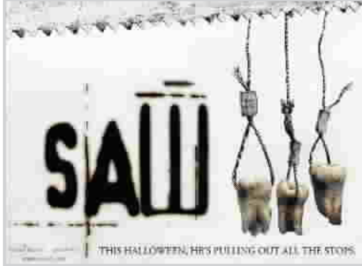
ملصق فيلم (المنشار)

هوليوود: ازاح الفيلم السينمائي الجديد "بورات" فيلم الرعب "المنشار" من قمة إيرادات السينما الأمريكية، محققاً مبيعات تذاكر قيمتها ٢٦,٤ مليون دولار. وتدور أحداث "Borat حول مذيع تليفزيوني من "قازاخستان" يسافر الى الولايات المتحدة في مهمة عمل يقوم بإعداد تقارير اخبارية عن أمريكا، وخلال عمله يتشغل "بورات" بالبحث عن الزواج من النجمة بامبلا اندرسون بدلاً من التركيز على عمله، والفيلم بطولة الممثل البريطاني ساشا كوهين. بينما جاء في المركز الثاني الفيلم السينمائي الجديد "سانتا كلوز: الجزء الثالث"، حيث حقق مبيعات تذاكر وصلت الى ٢٠ مليون دولار. وتدور أحداث الفيلم حول سانتا كلوز