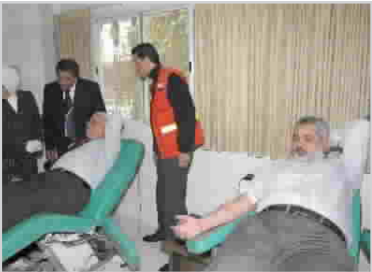
عباس مع هيئة في أحد مراكز التبرع الدم للجرحى الفلسطينيين

وصوت المجلس الثوري لحركة فتح وهو هيئة رئيسية لاتخاذ القرارات داخل الحركة في مدينة رام الله بالضفة الغربية لصالح تعيين عباس قائدا للانتخابات في وقت سابق من العام