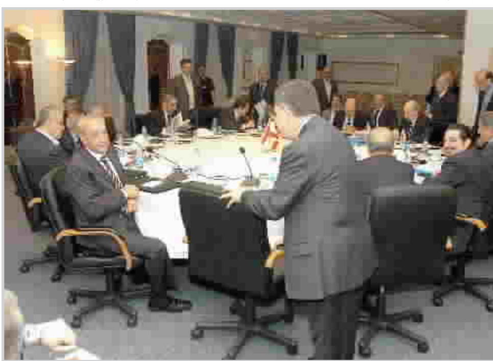
اجتماع لقادة الفصائل اللبنانية

وفي خطوة مفاجئة لحسم الجدل في الشارع اللبناني حول شرعية حكومة رئيس الوزراء فؤاد السنيرة، بعد استقالة الوزراء، قال الرئيس اميل لحود إن الحكومة فقدت شرعيتها الدستورية. وجاء في بيان أصدرته رئاسة الجمهورية اللبنانية، أن