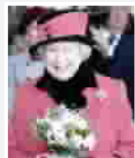
الملكة اليزابيث الثانية

ترأست الملكة اليزابيث البريطانية ذكرى الجنود الذين قتلوا في الحروب بوضعها كليلاً من الزهور على ضريح الجندي المجهول الذي يرمز الى الذين قتلوا في الحربين العالميتين وفي النزاعات التي اشتركت فيها بريطانيا. وبدأ الاحتفال بالوقوف دقيقتي صمت من قبل حوالي ثمانية الاف من المقاتلين القدماء والشخصيات التي شاركت في هذا الاحتفال الذي اقيم في لندن.