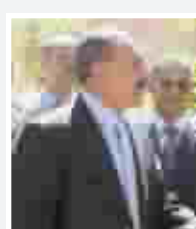
علي عبد الله صالح

دافع الرئيس اليمني علي عبد الله صالح خلال زيارته جامعة "الايمان" عن الشيخ عبد المجيد الزنداني رئيس الجامعة الملاحق من قبل الولايات المتحدة الاميركية. وقال صالح ان "الشيخ الفاضل عبدالمجيد الزنداني هو قطب من اقطاب الثورة ورجل من رجال الثورة ونحن نعتمد عليه كأستاذ ورئيس جامعة وسأخذ بيده ونعمل لبناء هذه الجامعة البناء العلمي الصحيح ونقدم المساعدات لها.