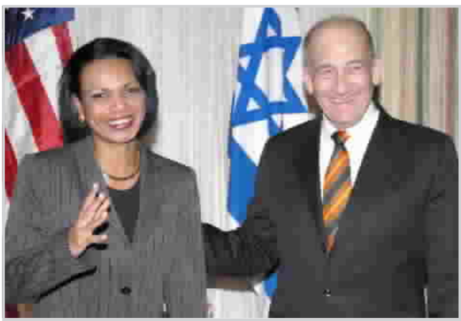
رايس مع أولمرت في اثناء زيارته لواشنطن

وتكتسب الانتخابات المحلية أهمية خاصة لأن الفائزين فيها سيقررون كيفية انفاق الملايين التي سيحصلون عليها من الاتحاد الأوروبي.