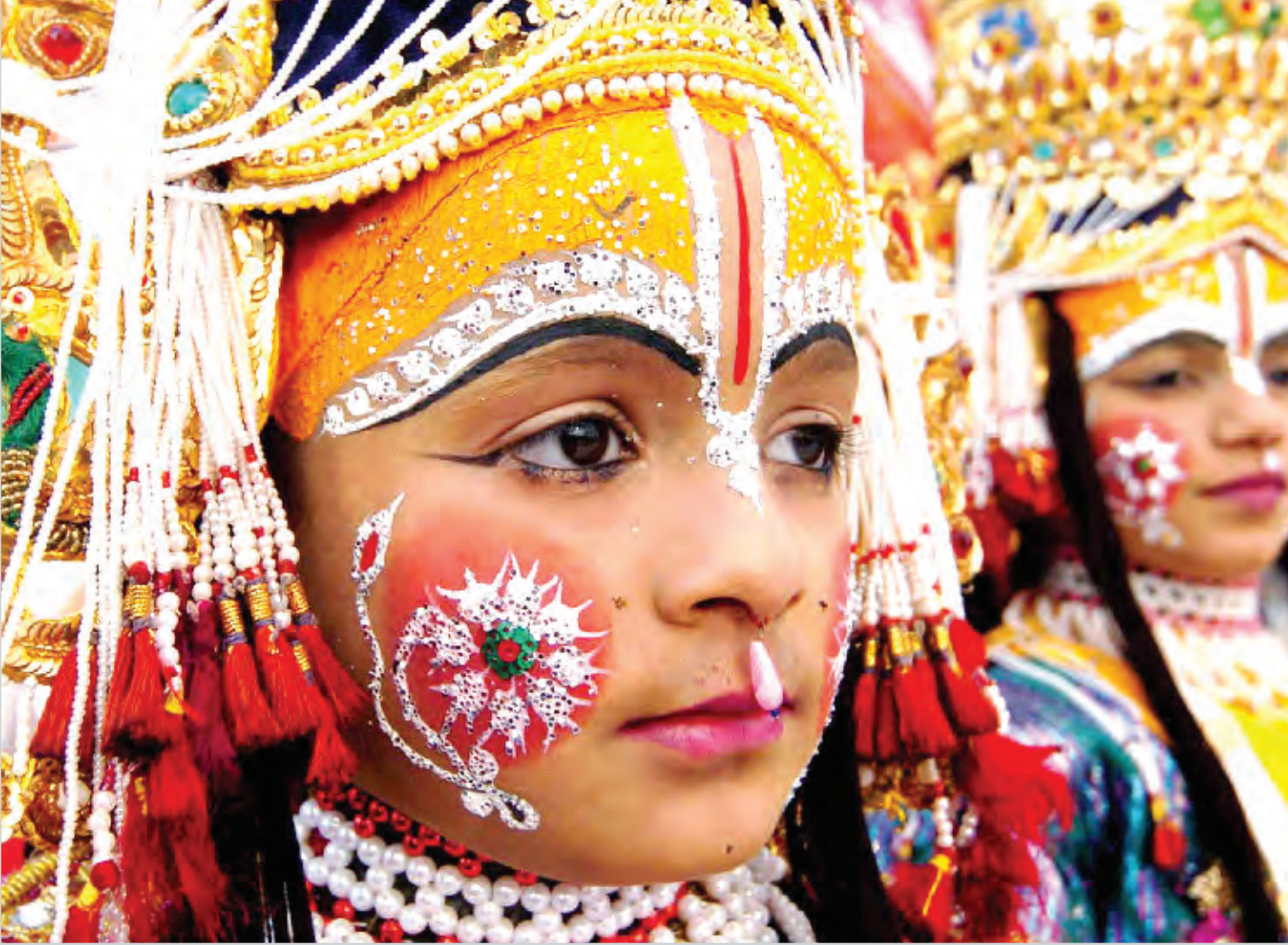
اطفال هنود يرتدون ملابس الهندوس التقليدية في إيمستارباهند أثناء عيد ميلاد أحد زعمائهم

القاهرة / ا ف ب بدأ المخرج المصري الشهير يوسف شاهين مساء السبت تصوير فيلمه الجديد "هي فوضى" الذي يقول انه يتناول ما تشهده مصر من فساد وقمع للحريات. وحضر بداية التصوير نجوم الفن مثل الفنان خالد صالح والفنانة الشابة منة شلبي التي استطاعت خلال سنوات قليلة ان تكون من نجوم الشاشة الكبيرة التي تقوم بدور فتاة من منطقة شعبية تحب شابا يعمل قاضيا يتعرض لضايقات من امين شرطة. وتلعب هالة صدقي دور ام القاضى في حين تقوم هالة فاخر بدور ام منة شلبي وتعمل كلتاهما على مساندة الفتى والفتاة في مواجهة ما يتعرضان له من ضايقات. اما الفنان احمد فؤاد سليم الذي يشارك في غالبية افلام يوسف شاهين