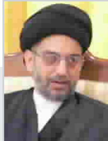
عبد العزيز الحكيم