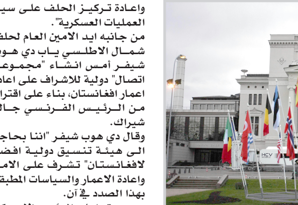
مقر اجتماع قادة الناتو في ألتينيا

وقالت شينخوا ان بوش أحاطه وعلمت بالموقف الأمريكي من درافور وانه اشار الى التقدم الايجابي الذي تحقق في الأونة الاخيرة وقال ان الحوار يجب ان يستمر.