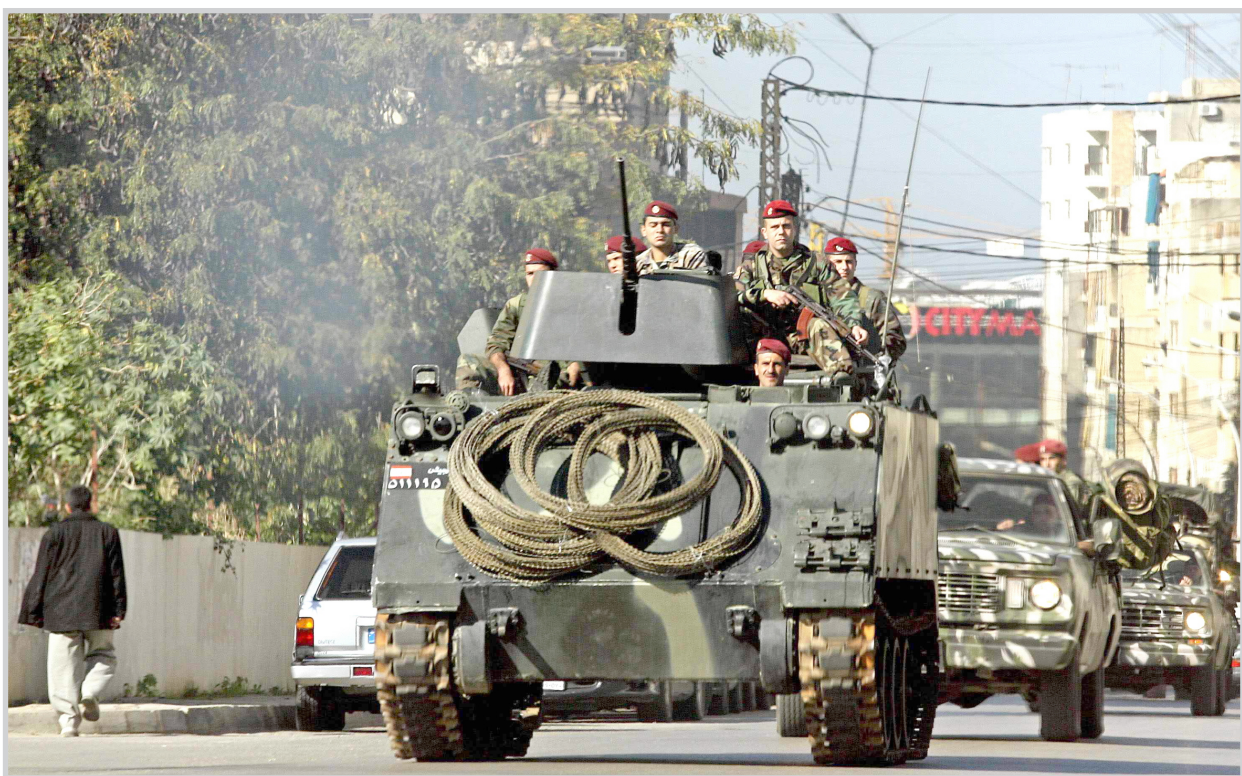
قوة مدرعة الجيش اللبناني تجوب شوارع بيروت

واوضحت المصادر ان الاشكال بين انصار الفريضين وقع في ساحة ساسين في منطقة الاشرفية المسيحية على خلفية اغتيال الوزير بيار الجميل.