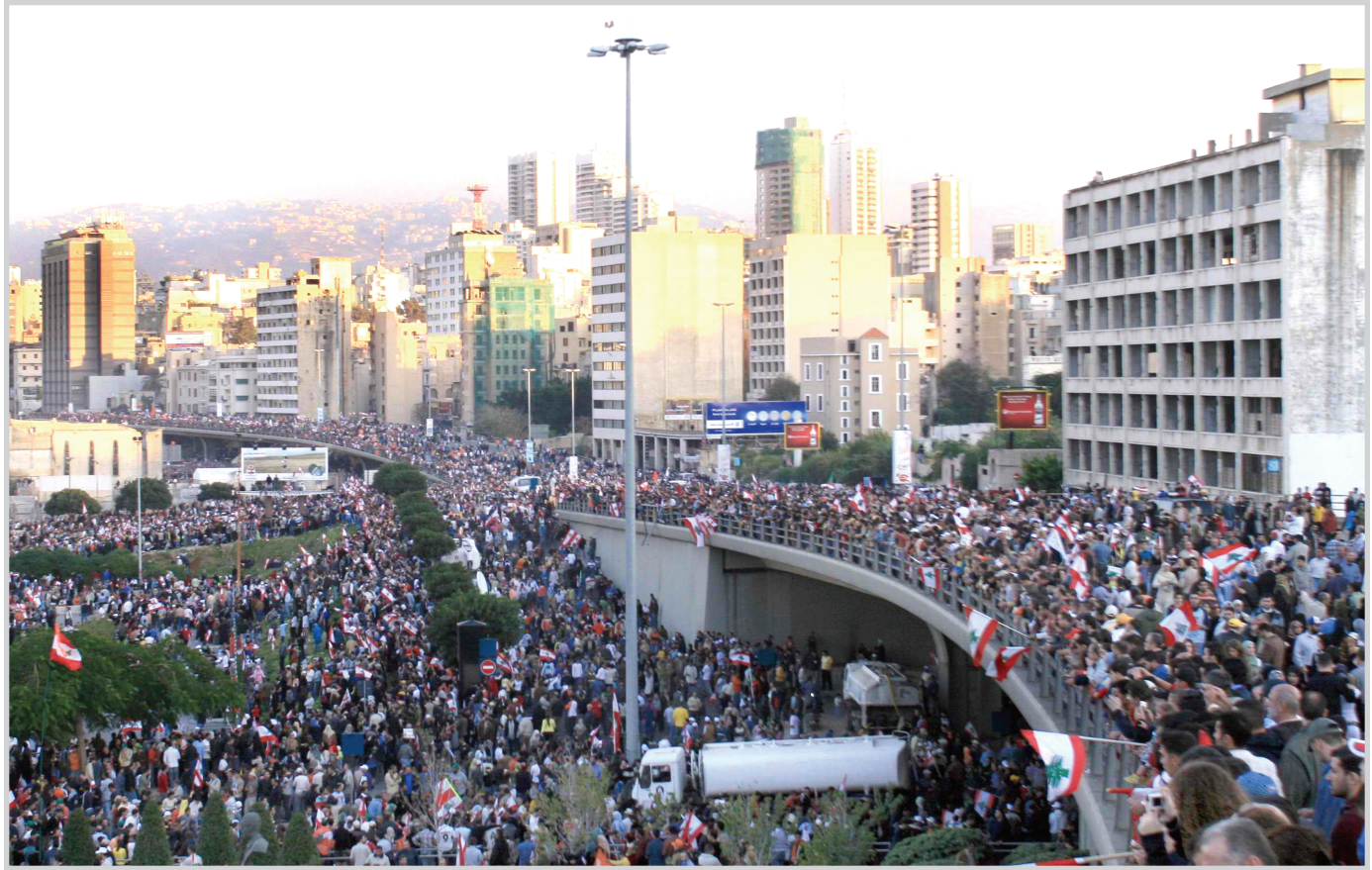
بيروت / الوكالات تواصل الاعتصام امام مقر رئاسة الحكومة اللبنانية في وسط بيروت وقد بدأ المتظاهرون صباح امس السبت يهتفون بشعارات مناهضة لرئيس الوزراء فؤاد السنيورة غداة تظاهرة ضخمة ضمت مئات الاف المعارضين المطالبين باسقاط الحكومة.

ويقف المعتصمون الذين يبلغ عددهم نحو خمسة آلاف وفق المنظمين على مسافة مئة متر من السراي الحكومي بسبب انتشار الجيش الذي يحول دون اقترابهم من القصر الحكومي. وفي ساحة رياض الصلح المقابلة لمقر رئاسة الحكومة وفي ساحة الشهداء القريبة نصبت نحو مئة خيمة وقيمت اكشاك لتقديم المأكولات والمشروبات للمعتصمين. وسمحت اتصالات بين الحكومة ورئيس مجلس النواب نبيه بري مساء الجمعة بفتح الطرق المؤدية الى مقر رئاسة الحكومة اللبنانية في وسط العاصمة بعدما سدتها خيم المعتصمين. ازاء ذلك توقفت الصحف اللبنانية الصادرة امس السبت عند "الافق المسدود" للازمة في لبنان غداة بدء الاعتصام المفتوح في وسط بيروت. وكتبت صحيفة "السفير" القريبة من المعارضين ان التظاهرة "لم تفتح كوة صغيرة في جدار الازمة السياسية التي بلغت وما تزال مرحلة الالف المسدود". وعنونت صحيفة "المستقبل" التابعة لتيار المستقبل الذي ينتهي اليه السنيورة خبرها الرئيسي "الانقلاب في يومه الاول شارع احادي بلا افق سياسي، واصفة