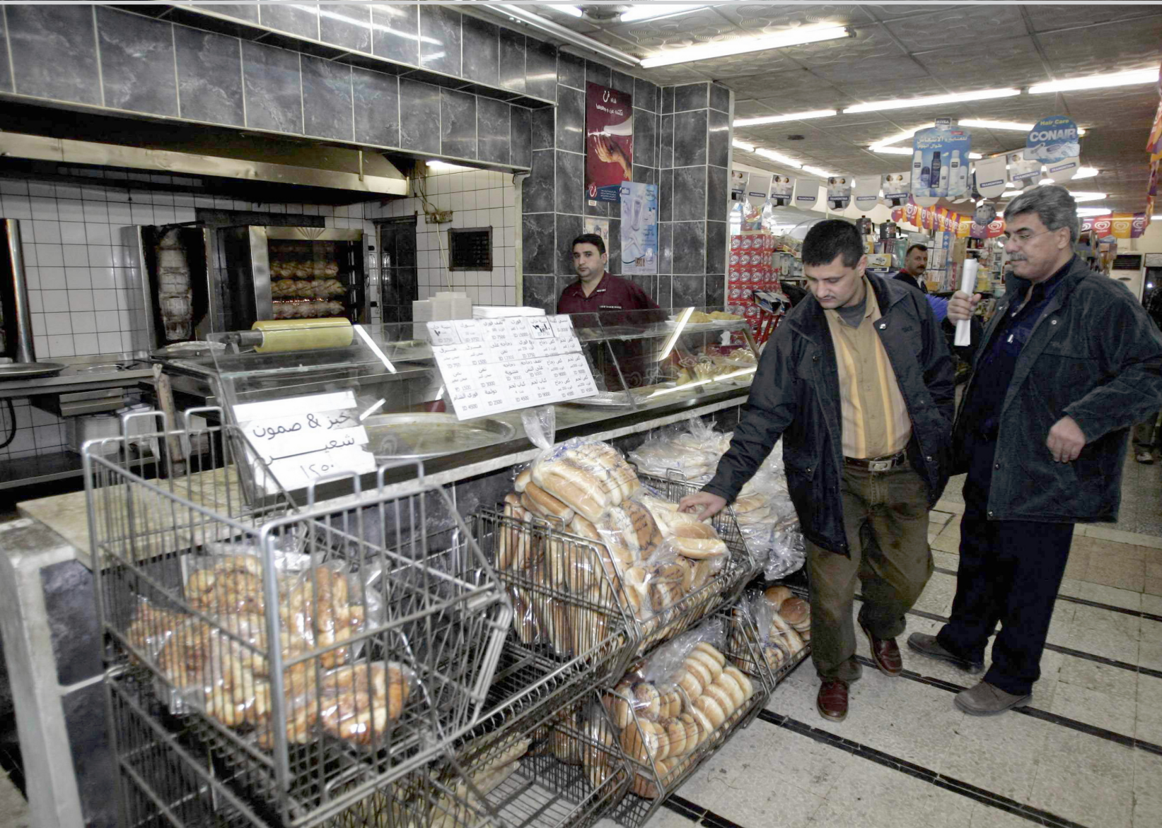
مواطنون يتبضعون من احد الاسواق في بغداد

طريقها الى الاسواق المحلية من خلال معبر ابراهيم الخليل الحدودي بسبب انتهاء مدة صلاحها للاستعمال البشري". ويحسب احصائيات مديرية كمرك ابراهيم الخليل الحدودية فان فرق الرقابة الصحية قد اتلفت حوالي ٧٠٠ طن من لحوم الدجاج الفاسد، خلال تشرين الثاني الماضي على التوالي، كانت تظنها ٤٧ التريكية للاسواق العراقية.