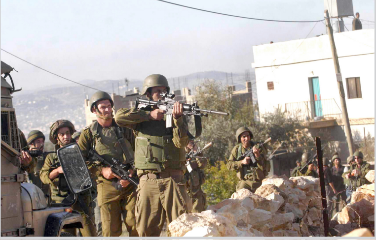
قوات الجيش الاسرائيلي تتعرض لإحدى التظاهرات.. من الرشيف