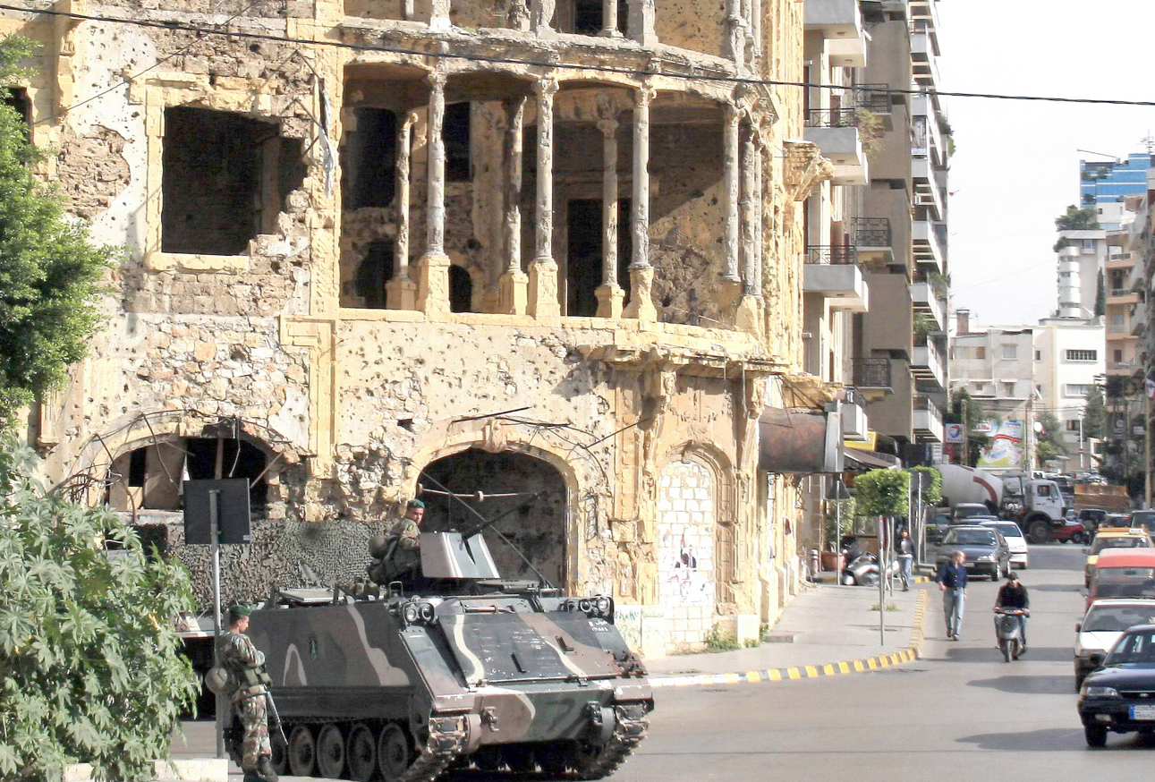
هل يعيد التاريخ نفسه.. دورية مدرعة للجيش اللبناني ترابط امام مبنى دمرته الحرب الاهلية اللبنانية

ووقعت المواجهات في قسطنطينية حين هاجم قاطنون في الحي موكبا لمعارضين، وتخلل ذلك عراك بالايدي والعصي وفق شهود عيان. وذكرت محطة تلفزيون المستقبل الناطقة باسم تيار المستقبل ويرئسه زعيم الاكثية النيابية سعد الحريري، ان الجيش اوقف ثلاثة مواطنين سوريين كانوا يرشقون المتظاهرين بالحجارة من على سطح احد الابنية في