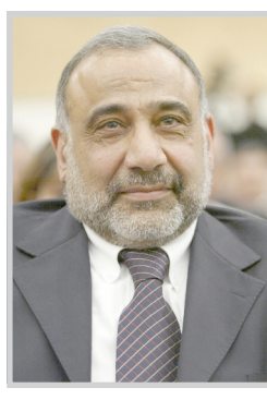
عادل عبد المهدي

بغداد / المصفا أكد نائب رئيس الجمهورية الدكتور عادل عبد المهدي انه بالإمكان النهوض بالصناعة العراقية في حال تقديم الدعم الكافي رغم تأثرها بالمتغيرات الاقتصادية التي عاشتها البلاد من خلال فرض ادارات صناعة إبتزازية والظروف الاستثنائية الحالية. جاء ذلك خلال افتتاحه المعرض الصناعي النوعي الاول الذي نظّمته وزارة الصناعة والمعادن يوم امس على ارض معرض بغداد الدولي ويستمر عشرة ايام. وأضاف: ان هذا المعرض ليس بالحدث البسيط الذي يقام على ارض المعارض في بغداد التي شهدت العديد من المعارض الدولية منذ مطلع الستينيات. كما أشاد بالجهود العظيمة التي يبذلها منسبو الوزارة والهندسية والفنية. وقال ان هذه المنجزات المحيطة التي تشمل فخر الصناعات العراقية من المنتجات المحلية تعد خطوة الى الامام في دائرة الانتاج والتي تشمل قدرة المجتمع على التقدم والتطور ومواكبة التطور الحاصل في الصناعات العالمية. مشيراً الى ان فلسفة الادارة الاقتصادية الحديثة للبلاد تعد عاملاً مهماً واساسياً في خلق فرص جديدة ومتطورة ومواكبة التطور الحاصل في الصناعة العراقية وعلينا جميعاً ان نسهم في التعويض عن المنتج المحلي. وبين الدكتور عادل عبد المهدي اهمية اعادة تأهيل المنشآت الصناعية والتي كانت تدار بشكل إبتزازي مؤكداً وضع دراسات خاصة في هذا المجال من خلال دراسات الجدوى وادارة السوق وان تدخل فيه الثقافية الصناعية. ومن جهة اخرى كشف وزير الصناعة والمعادن