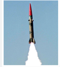
الصاروخ حتف ٣

تجربة أجرت باكستان تجربة على نسخة جديدة من صاروخ قصير المدى قادر على حمل صواريخ نووية، وفق ما أعلن الجيش الباكستاني أمس السبت، ويبلغ مدى الصاروخ الباليستي "حتف ٣" (غازاني)، والذي أطلق من موقع لم يكشف عنه، ٢٩٠ كيلومترا. وذكر الجيش الباكستاني في بيانه أن الصاروخ أصاب هدفه، نقلاً عن الأوسبيتد برس.