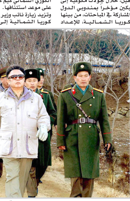
الزعيم الكوري الشمالي كيم جونج مع مجموعة من قادة جيشه