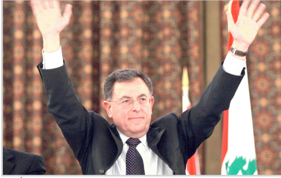
رئيس الوزراء اللبناني فيؤاد السنيورة يلوح بيديه مؤيديه في أثناء القائه خطاباً عليهم

منا بعد لتعطيل الحكومة". وقد استقال في ١١ تشرين الثاني خمسة وزراء شيعية من الحكومة تلاهم وزير سادس مسيحي. ومع اغتيال الجميل، بات عدد الوزراء ١٧ من ٢٤، أي الثلثين زائد واحد. والصاب المطلوب لبقاء الحكومة دستوريا هو ثلثان. وقالت معوض "نحن لسنا هنا لنختبئ من المتظاهرين الا اذا كان هؤلاء يقفون الى جانب الذين يرتكبون الاغتيالات".