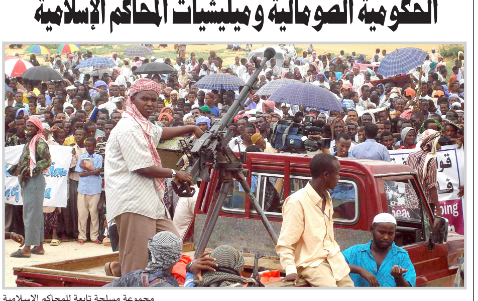
مجموعة مسلحة تابعة للمحاكم الاسلامية

في مقديشو قد أعلن ان الاسلاميين الصوماليين سيهاجمون مدينة بيداعة التي تضم مقر الحكومة الانتقالية الصومالية بعد المعارك التي وقعت الجمعة جنوب المدينة. وقال المتحدث باسم المجلس عبد الرحيم علي مودي "لقد قاتلناهم ولن نوقف القتال. سنهاجم بيداعة ونأخذها منهم ونستولي عليها". يذكر ان قتالا عنيفا اندلع يوم الجمعة بين مقاتلين اسلاميين وجنود صوماليين واثيوبيين يحمون قاعدة مدينة بيداعة في بيداعة مما اسفر عن مقتل شخصين. وقال الرئيس التنفيذي للمجلس الاسلامي الأعلى في الصومال الشيخ شريف شيخ احمد امام حوالتى خمسة الاف متظاهر تجمعوا في "معارك عنيفة بدأت في منطقة دينسور" المدينة الواقعة على بعد ١١٠ كيلومترا جنوب بيداعة (٢٥٠ كلم شمال غرب مقديشو). مضيفا ان القوات الاثيوبية تعهدت بالوقوف الى جانب القوات الحكومية الصومالية.