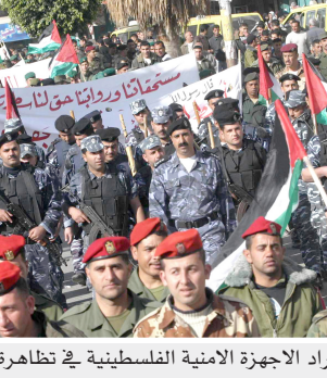
افراد الاجهزة الامنية الفلسطينية في تظاهرة للمطالبة برواتبهم

وقعت اللجنة التنفيذية لمنظمة التحرير الفلسطينية برئاسة الرئيس الفلسطيني محمود عباس أمس السبت اجتماعا لتقرر الخيار المناسب لحل ازمة الحكم في السلطة الفلسطينية.