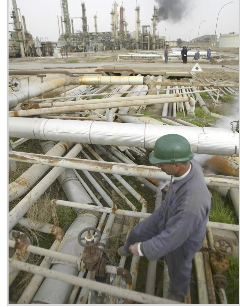
احد العمال في مصفى للنفط

استخراج الكمية العظمى من الحقول. من هنا تأتي اهمية استخدام اساليب جديدة لرفع كمية الانتاج من البئر ولتعزيز دور العراق النفطي في السوق العالمية للنفط ولحسب المزيد من العوائد النفطية وخاصة مع وجود اسعار نفط مجزية. ومن تلك الاساليب الجديدة ما يعرف بـ(الآبار الذكية-smart wells) ومفهوم الآبار الذكية ينصرف الى منظومة متكاملة تنشط برصد وتكيف تدفق النفط الخام من المكن. ويتحقق ذلك من خلال الجمع بين التكنولوجيا المتسبة للبيانات والقدرات التي توفرها اجهزة الحاسوب لتحليلها في زمن معد مسبقاً او محدد وكذلك بالتعاون مع انظمة التحكم التي تمكن من تنظيم وضبط تدفق النفط بطرق معروفة هذا الاسلوب في الاستخراج غير معروف في الصناعة النفطية العراقية فالمعدات المستخدمة في هذه الصناعة مجهزة للعراق منذ الستينيات من القرن الماضي وللتاكيد على ذلك يشير الاستاذ جبار علي العبيبي المدير العام لشركة نفط الجنوب وهي رابع اكبر شركة نفط في العالم- اثناء لقائه بالسيد وزير النفط في زيارته للشركة في ٢٠٠٦/٨/٧ الى ان جميع معدات شركة نفط الجنوب متقادمة ومستهلكة نواجه مشاكل في حقول البصرة وحقول ميسان في محطات حقن الماء التي نصبت قبل السبعينيات لا يمكن ان ننجز جميع المشاريع الكبيرة دون وقوف وزارة النفط على حقيقة ما يجري- مجلة نفطنا، العدد (٢٢) ايلول ٢٠٠٦، ص٩.