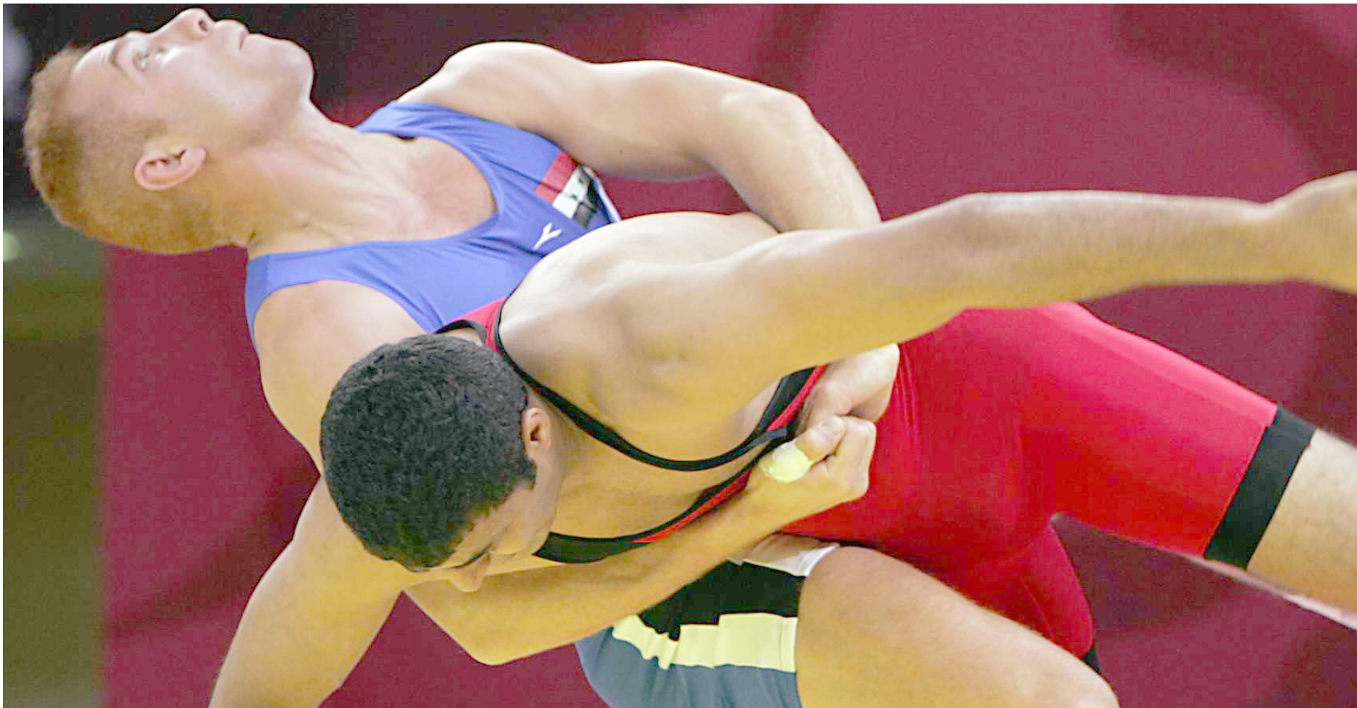
منافسات مثيرة للعبة المصارعة فوق البساط الاسوي