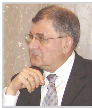
الدكتور عبد اللطيف جمال رشيد

تركيا ستترك اثرا سلبيا كبيرا على واقع المياه في العراق من حيث كمية الامدادات المائية ونوعيتها، مؤكدا سعي العراق الدائم نحو التوصل الى قسمة عادلة للمياه المشتركة من خلال مشاركته في تشكيل لجنة ثلاثية مع الجارين التركي والسوري، عقدت منذ انبثاقها عام ١٩٨٠ ستة عشر اجتماعاً حتى عام ١٩٩٢ حيث توقفت عن العمل دون التوصل الى اتفاق بهذا الشأن. وقال: ان العراق ما زال يحاول احياء اعمال هيئة اللجنة للتوصل الى قسمة عادلة للمياه ترضي جميع الاطراف. وأكد وزير الموارد المائية ان نحو ٧٥٪ من واردات العراق المائية تأتيه من خارج حدوده، اذ ان ما نسبته ٢٨٪ من مياه نهر دجلة تتكون خلال الأراضي العراقية، وهو حوال ٨٨٪ من مياه نهر الفرات، ما يشد الضغط لجهة عقد اتفاق اقليمي حول توزيع المياه بضمن حقوق الجميع، مشيراً الى ان ما يمنح العراق حق المطالبة بحقوقه المائية