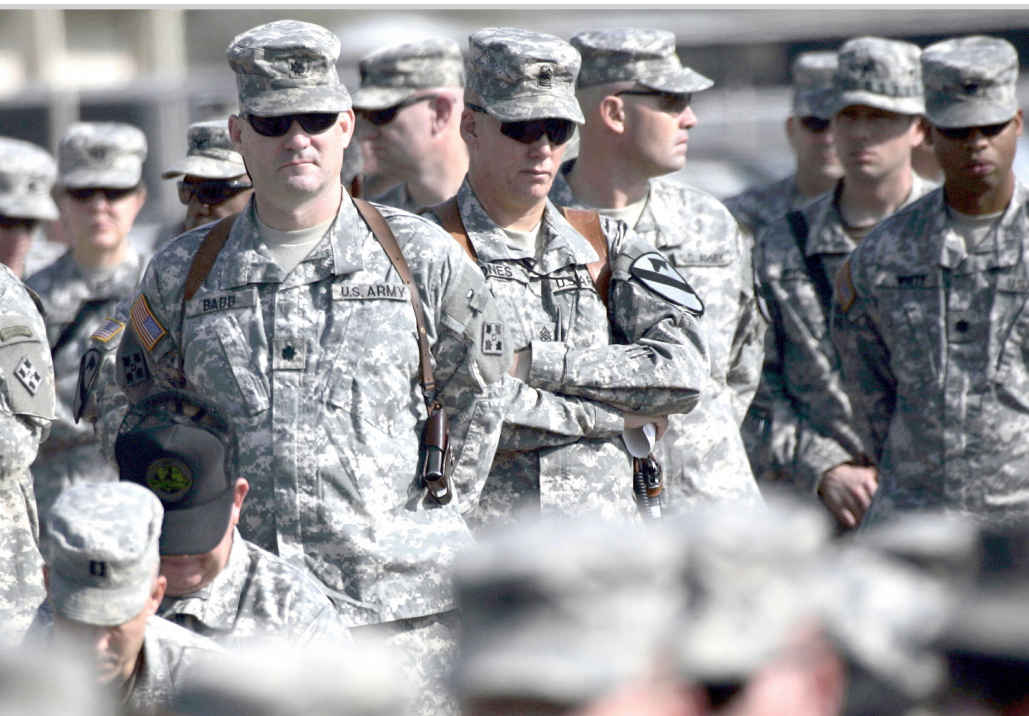
مجموعة من قوات مشاة البحرية الأمريكية (المارينز)

واقترحت لجنة مؤلفة من أعضاء من الحزبين الجمهوري والديمقراطي بقيادة وزير الخارجية السابق جيمس بيكر والنائب الديمقراطي السابق ثي هاميلتون ان تبدأ الولايات المتحدة التخطيط لسحب قواتها من العراق. الا ان آخرين بينهم السناتور جون ماكين من اريزونا يقولون ان ثمة حاجة لزيادة القوات على المدى القصير لاشاعة الاستقرار في البلاد لاعطاء العملية السياسية فرصة للنجاح. وقال نائب رئيس الجمهورية طارق الهاشمي انه يتعين على الولايات المتحدة تعزيز وجودها العسكري في بغداد التي تشهد أسوأ أعمال العنف. وقال لبرنامج الطبعة الاخيرة بقناة (سي.ان.ان). التلفزيونية ان "القوات غير كافية للتصدي (لموضوع) الامن بالشكل المطلوب في بغداد وبماكانكم في الواقع أن تروا بوضوح النفوذ المتزايد للمليشيات في بغداد