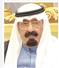
عبدالله بن عبد العزيز

افاد مصدر دبلوماسي خليجي لوكالة الصحافة الفرنسية ان المعامل السعودي الملك عبدالله بن عبد العزيز سيزور سلطنة عمان السبت المقبل ويلتقي السلطان قابوس بن سعيد. وقال المصدر الذي فضل عدم الكشف عن اسمه ان الملك عبد الله سيقيم بزيارة الى سلطنة عمان السبت ويلتقي السلطان قابوس "دون ان يدلي بتفاصيل حول مدة الزيارة والمواضيع التي سيتم التطرق اليها خلالها".