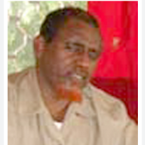
حسن طاهر أوبس

إنداز قال رئيس مجلس شورى المحاكم الإسلامية في الصومال الشيخ حسن طاهر أوبس إن الإنداز الذي وجهته المحاكم لإثيوبيا وينتهي الاثنين هو نوع من إعطاء الفرصة. وأشار في تصريحات صحفية إلى أن الحرب قائمة وأعلنتها إثيوبيا. واتهم الشيخ أوبس هيئات الإغاثة الغربية وتلك التابعة للأمم المتحدة بتغذية الصراع في الصومال. وكشف عن خريطة نشرتها إثيوبيا مؤخرا تمحو الصومال من الخريطة وتجعلها جزءا من الأراضي الإثيوبية.