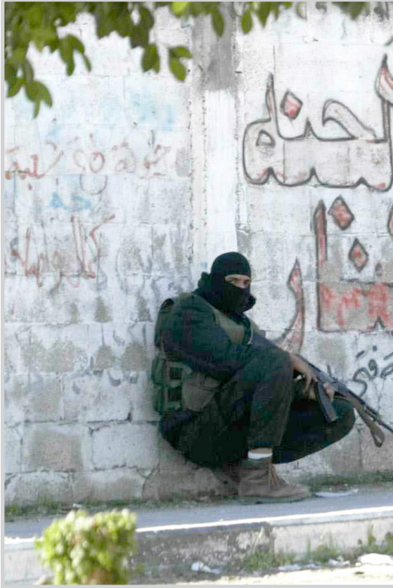
عناصر فلسطينية مسلحة تشترك مع عناصر لفصائل اخرى في صراع بين الاخوة.. أمس

محددة بشأن اي خطط. لكن أولمرت أعلن بعد الاجتماع مع بليير في مسمى فيما يبدو لدعم عباس ان اسرائيل تعتزم تشكيل لجنة مشتركة مع المسؤولين الفلسطينيين لمناقشة قضية الافراج عن فلسطينيين محتجزين في السجون الاسرائيلية. وفي تطور لاحق صرح السفير الفلسطيني في عمان أمس ان مكتب الادارة السياسية لمنظمة التحرير الفلسطينية في السفارة الذي يرأسه فاروق القدومي أغلق الاثنين بقرار من الرئيس محمود