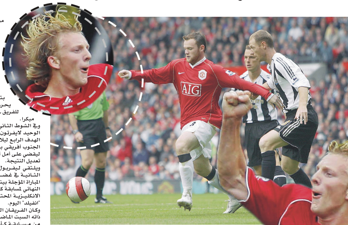
روني يشارك لارسن في تحقيق الانتصارات لمانشستر