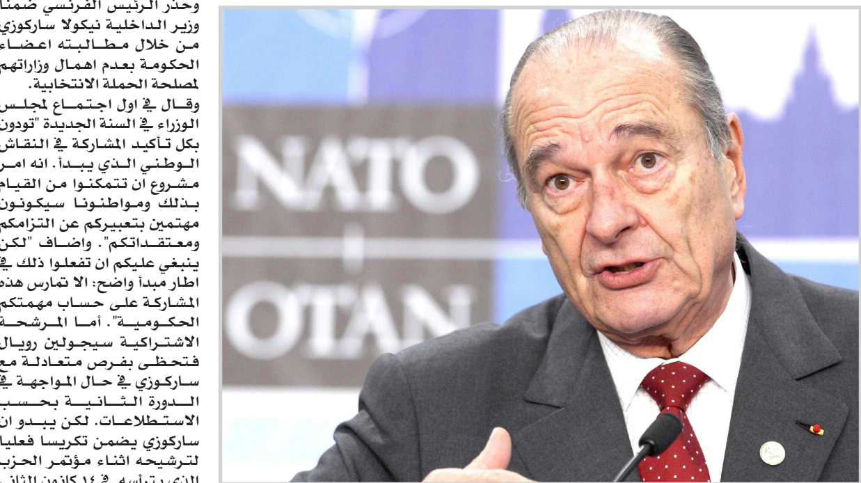
الرئيس الفرنسي جاك شيراك

قالت مصادر أمنية تونسية إن حال التعبئة التي أعلنت في قوات الجيش والدرك والشرطة أواخر الشهر الماضي لدى اندلاع الاشتباكات والمطاردات، انتهت رسمياً قبل يومين بعد القضاء على آخر جيوب الاحتكاكات. واضافت مصادر أخرى ان حملة اعتقالات واسعة ما زالت مستمرة في صفوف شباب يشتبه في انتمائهم إلى تيار "السلفية الجهادية" خصوصاً في محافظة سيدي بوزيد (وسط) وقبلي (جنوب) وبنزرت (شمال).