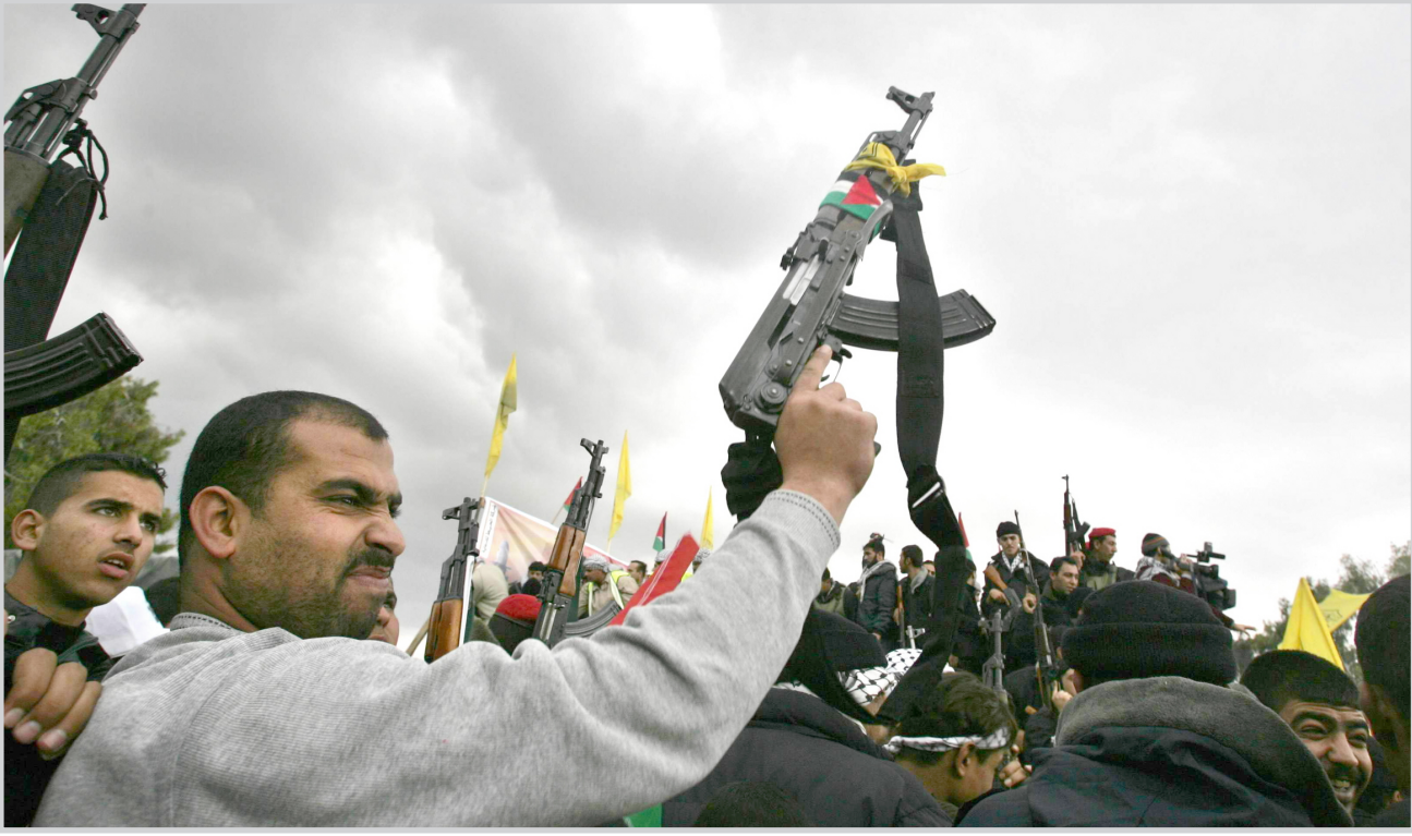
تظاهرة فلسطينية تأييداً لإحدى الفصائل المسلحة في اثر المبادرات الكلامية بين فتح وحماس.. أمس

وفي تلك الاثناء انتقدت ستة فصائل فلسطينية قرار الرئيس محمود عباس الذي يعتبر القوة التنفيذية غير شرعية معتبرة ذلك تناغماً مع مؤامرات الخارج. واتهم الناطق باسم الولاية صلاح