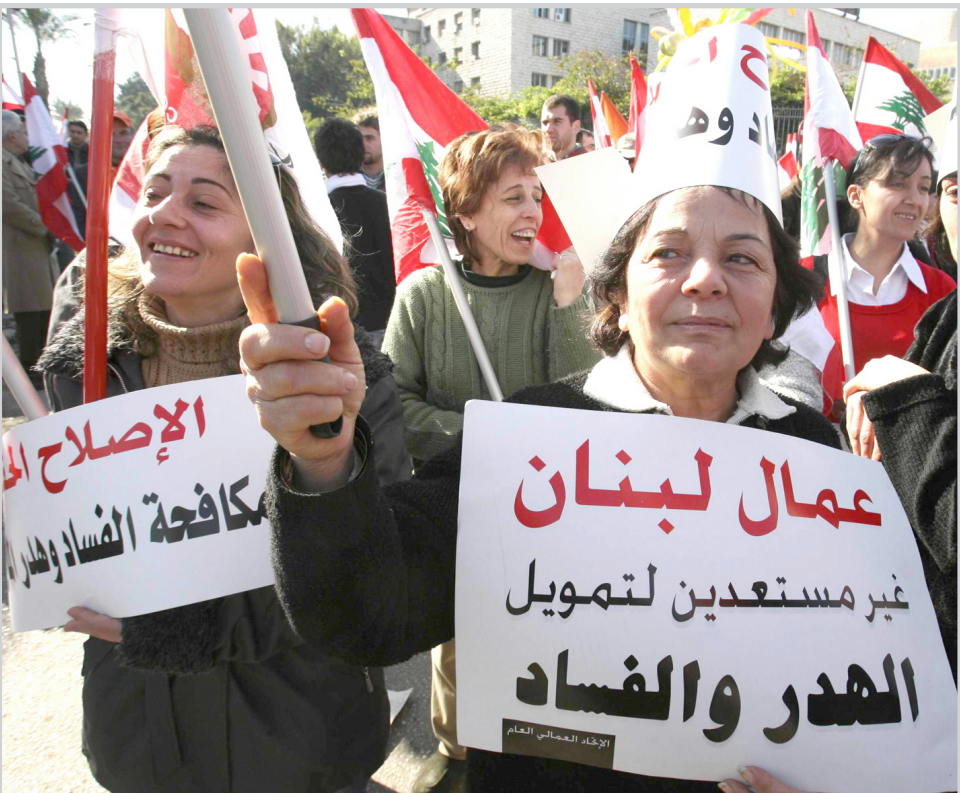
عمال لبنان يتظاهرون ضد حكومة السنيورة.. بيروت/ أمس

وشن العماد عون هجوما على السفارة الغربية وعلى ما سماه "الوصاية الدولية" التي اعتبرها احط من "الوصاية السورية" التي قال عنها انها "رفعت". وقال "أذكر السنيورة ان دعم اميركا له لن يجعله بقوة اميركا (...). ولن يجعل منه رئيسا قويا في لبنان".