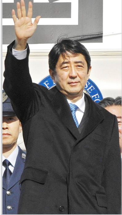
رئيس وزراء اليابان شينزو آبي

للإيبان. وأعرب عن اعتقاده بان كوريا الشمالية تشكل مصدرا للخطر على السلم العالمي. وقال ابي " ان امتلاك كوريا الشمالية لاسلحة نووية سوف يؤدي الى انتشار اسلحة الدمار الشامل في المنطقة".