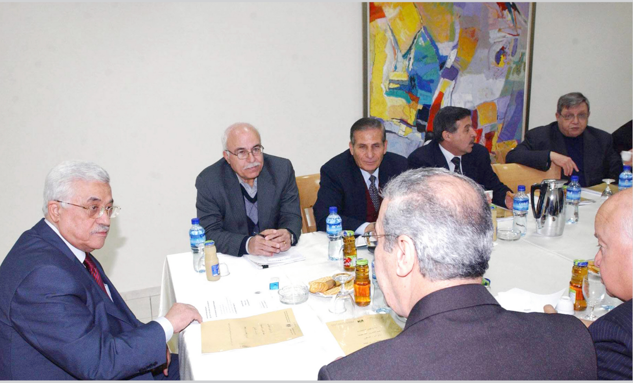
محمود عباس مع الكادر القيادي المتقدم

يحدث في غزة إلى الضفة الغربية. ووصف عمليات إطلاق النار والاختطاف التي تكررت في العديد من مناطق الضفة والقطاع بأنها مشبوهة وتهدف إلى شق الصف الفلسطيني. يأتي هذا في الوقت الذي أفاد فيه المتحدث باسم القوة التنفيذية التابعة لوزارة الداخلية الفلسطينية أمس الثلاثاء أن ثلاثة من أفراد القوة أصيبوا بجروح اثر إطلاق قذيفة على سيارتهم في جباليا في شمال قطاع غزة. وقال اسلام شهوان المتحدث باسم