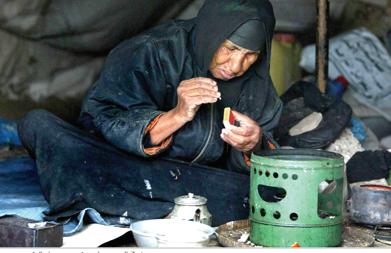
عجوز في الشوارع القاس

بغداد / نصير العوام يتربقب الشارع البغدادي انطلاق الخطة الامنية الجديدة حيث تشير الترسيمات الواردة من المصادر الحكومية الى احتمال انطلاقها اليوم الاثنين . وعلمت (المدى) من مصدر مطلع ان الخطة ستطلق اليوم الاثنين بعد ان تم تقسيم بغداد الى منطقتي (الكرخ والرصافة) واللتين قسمتا بدورهما الى تسع مناطق . وقال المصدر ان قوات الشرطة سيكون لها تمركز كبير في جانب الكرخ فيما سيكون لقوات الجيش الدور الكبير في منطقة الرصافة . واضاف: ان الضريق يعود بغداد / نصير العوام يتربقب الشارع البغدادي انطلاق الخطة الامنية الجديدة حيث تشير الترسيمات الواردة من المصادر الحكومية الى احتمال انطلاقها اليوم الاثنين . وعلمت (المدى) من مصدر مطلع ان الخطة ستطلق اليوم الاثنين بعد ان تم تقسيم بغداد الى منطقتي (الكرخ والرصافة) واللتين قسمتا بدورهما الى تسع مناطق . وقال المصدر ان قوات الشرطة سيكون لها تمركز كبير في جانب الكرخ فيما سيكون لقوات الجيش الدور الكبير في منطقة الرصافة . واضاف: ان الضريق يعود