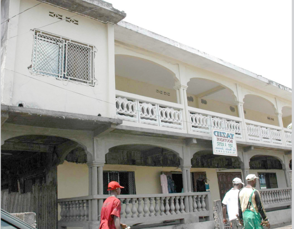
سوق تجاري في مقديشو

فقدت القوى الامنية التابعة للحكومة الصومالية المؤقتة غارات في العاصمة مقديشو سعياً لمصادرة اسلحة ومتفجرات من المدنيين ومسلحي العشائر بعد يوم من اعلان حالة الطوارئ. ومن بين الذين تم تجريدهم من السلاح حرس اهم المستشفيات الخاصة في العاصمة. وشكا بعض المدنيين من ان مصادرة سلاحهم ستركهم عرضة لهجمات اللصوص. واجرى الرئيس الانتقالي عبد الله يوسف اجتماعات مع وجهاء المدينة لحضهم على المساعدة في ضمان الامن.