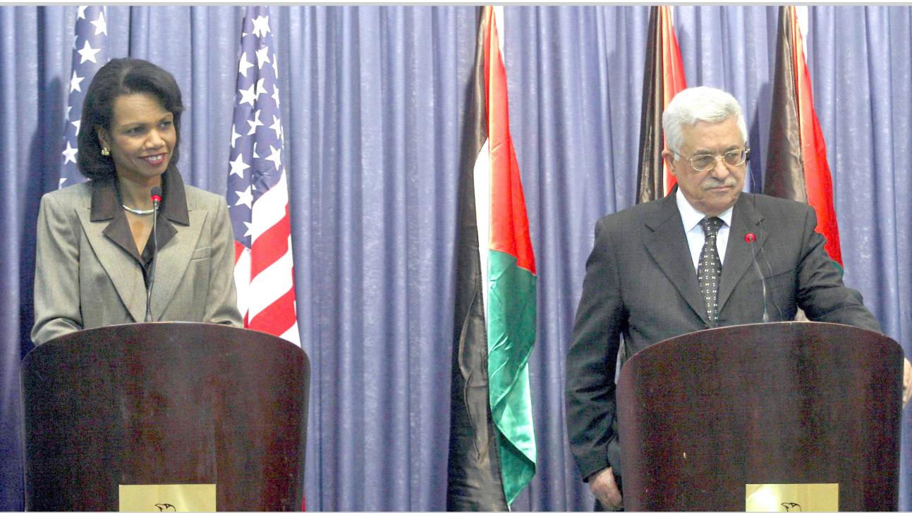
عباس ورايس في مؤتمر صحفي مشترك

الدفاع الإسرائيلي افراميم ارسال قوة دولية محملة تابعة لحلف شمال الأطلسي مثلا، الى قطاع غزة لضمان الامن. وقال سنيه للاذاعة الاسرائيلية العامة "لم الاحظ حماسا من دول الحلف باستثناء تركيا، لارسال وحدات الى مخيمات اللاجئين (الفلسطينيين) في قطاع غزة". واضاف "بالنسبة للاسلاميين المتطرفين، هؤلاء الجنود ذوو العيون الزرقاء سيكونون اعداء ايضا ولن يشكوا حلا بل جزءا من مشكلة" العنف في قطاع غزة.