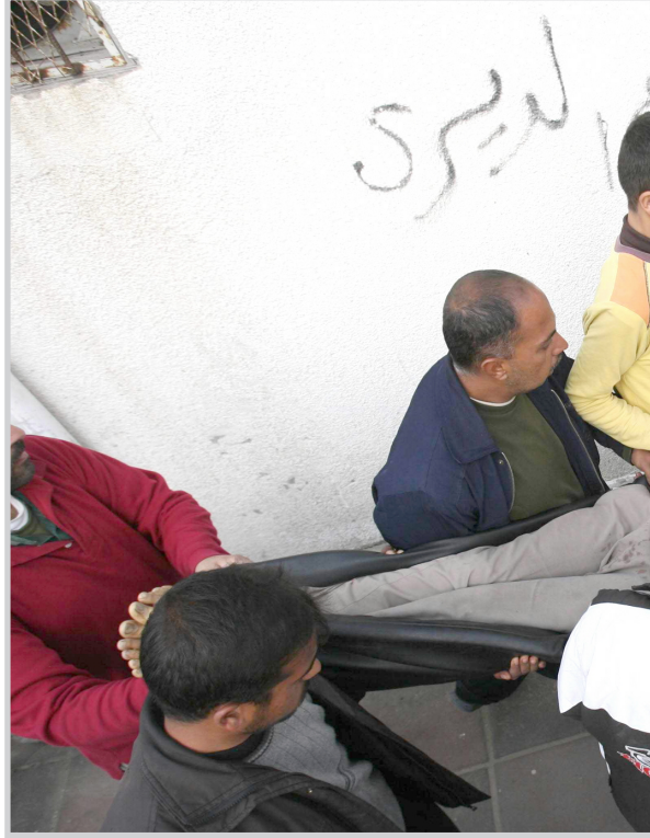
مواطنون ينقلون احد الجرحى الفلسطينيين الى المستشفى

سوريا لبحث كيفية المضي قدما بشأن القضايا الاسرائيلية الفلسطينية. وقال شون ماكورماك المتحدث باسم وزارة الخارجية الامريكية "يجب ان تسعى للحصول على دعم اعضاء ريعاعي الوساطة والاعضاء الاخرين في المجتمع الدولي لهذه المبادرة". ويؤيد ريعاعي الوساطة "خارطة الطريق" المقترحة للسلام التي اعدت في عام 2003 وقدمت اطارا لهدف التوصل لتسوية نهائية بحلول عام 2005 للصلراع الاسرائيلي الفلسطيني وهو الموعد الذي انقضى منذ فترة طويلة.