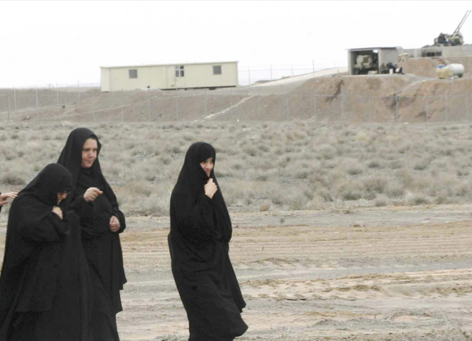
ايرانيات يعبرن من امام احد مواقع الدفاع الجوي ايرانية

الاميركية عن ثقتها بان فرنسا والولايات المتحدة يحركهما العزم نفسه على منع ايران من امتلاك السلاح النووي، مقلدة من شأن تصريحات الرئيس الفرنسي جاك شيراك التي عكست خلافا بين باريس وواشنطن حول طريقة مواجهة الملف النووي الإيراني. وفتت البيت الابيض وزارة الخارجية الى ان شيراك