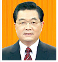
هو جينتاو يومين ومن المتوقع ان تتطرق مباحثاته مع البشير الى الوضع في اقليم دارفور المضطرب.