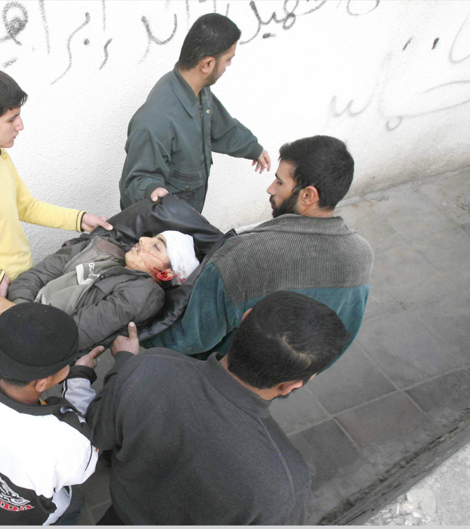
مواطنون ينقلون احد الجرحى الفلسطينيين الى المستشفى