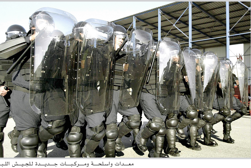
معدات واسلحة ومركبات جديدة للجيش اللبناني

واضاف ان هذه الاسلحة ستعود في نهاية المطاف الى الجيش اللبناني المنتشر في جنوب لبنان للدفاع عن حدوده "ضد المعتدي الاسرائيلي".