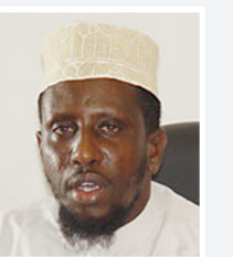
الشيخ شريف أحمد

وصل رئيس المجلس التنفيذي للمحاكم الإسلامية في الصومال الشيخ شريف أحمد إلى صنعاء الخميس قادما من نيروبي في إطار اتفاق بين اليمن وحكومتها الصومال وكينيا وفق ما أعلن مصدر مسؤول في الخارجية اليمنية. ونقلت مصادر صحفية عن المصدر قوله ان استقبال صنعاء الشيخ شريف يأتي في إطار الجهود اليمنية التي تهدف لتحقيق المصالحة الوطنية الصومالية وإعادة الأمن والاستقرار الى هذه الدولة.