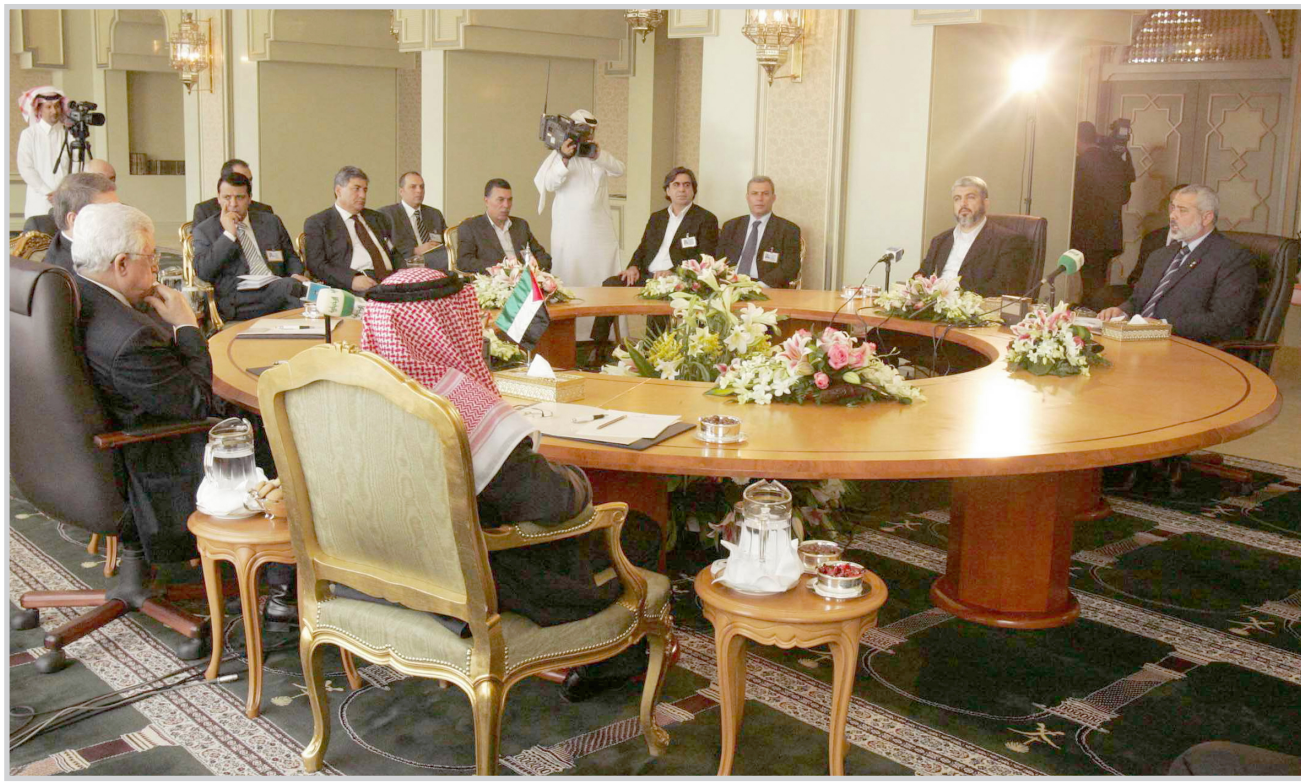
جانب من مباحثات مكة