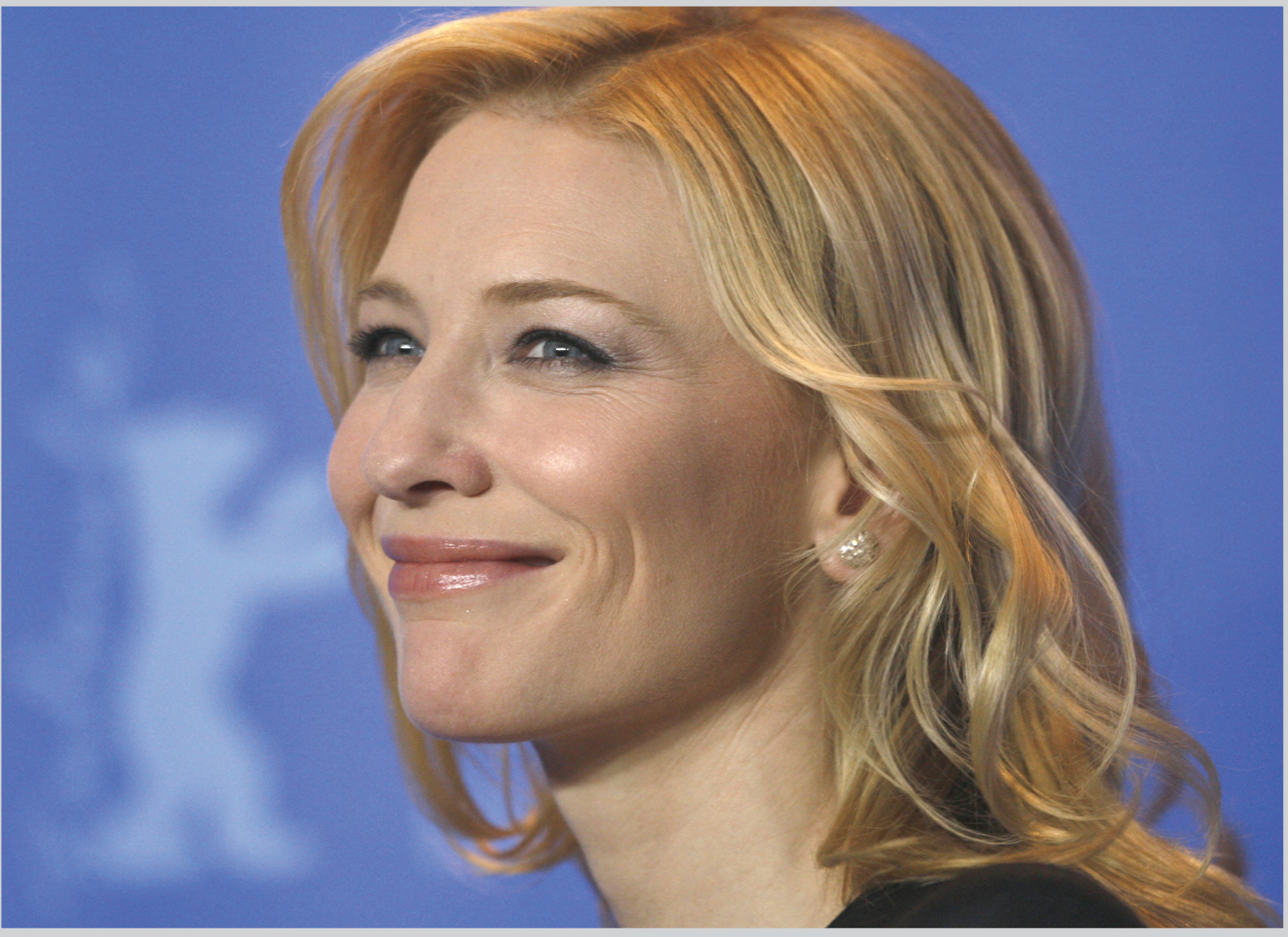
برلين، ألمانيا الممثلة الألمانية كيت بلانشيت تقف امام عدسات التصوير لدى حضورها عرض فيلم الالماني الطيب في اليوم الثاني من مهرجان برلين الـ٥٧ في ٢/٩ وهو واحد من ٢٢ فيلماً يعرض للمجانزة

المخرج كميل خالد سبق له ان اخرج عدة اعمال مسرحية اهمها: (سيكاستينا) ٢٠٠٣ و(احداث ١١ سبتمبر) التي عرضت في مهرجان المسرحية الاميركي الذي اقيم في عام ٢٠٠٥ في ولاية نورث كارولينا) و(سافر في ليل) وقدمت اربعين مسرحية (الراحل د. عوني كرومي في اتحاد الادباء ببغداد.. ويقول عن مسرحيته الجديدة (غرفة انعاش) : هي شبيهة للوضع الحالي الذي نعيشه الان وكاننا نحن في غرفة انعاش قد لا نخرج منها سالمين فالواقع الذي يقدمه العمل والشخصيات التي يقدمها هي لكي نخرج هذا الوطن من هذه الغربة سالما مضيفا ان هذا المفهوم يطرحه العمل بشكل ملموس وواضح وباللغة الشعبية العراقية لكي يصل من مضمون العمل بشكل سهل والاكبر عدد ممكن من ابناء المجتمع حيث يهدف العمل الى جعل المتلقي يفكر بواقعه وابداع حل لازماته عبر مشاهدته لهذا العمل الذي تداعي لتجسيده حيا على خشبة المسرح الوطني الفنانون غسان اسماعيل وحسين علي حسين ومحمد عطشان وريتكا كاسبر وحيدر جمعة وفكرت سالم ومحمد مونيكا وعدي سعدون وحيدر عبد ثامر وغيث خالد ووريد عباس وباشرف د. يوسف رشيد في حين تولى الادارة المسرحية: سهيل نجم والتقنيات : حسين مطشان.