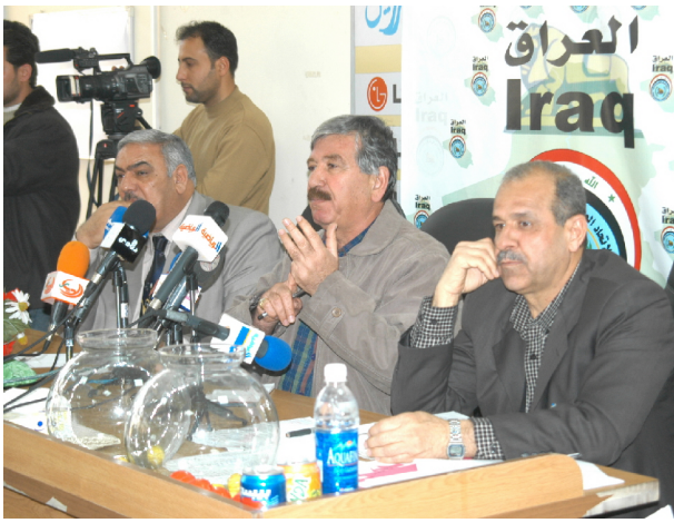
جانب من سحب قرعة دوري بغداد