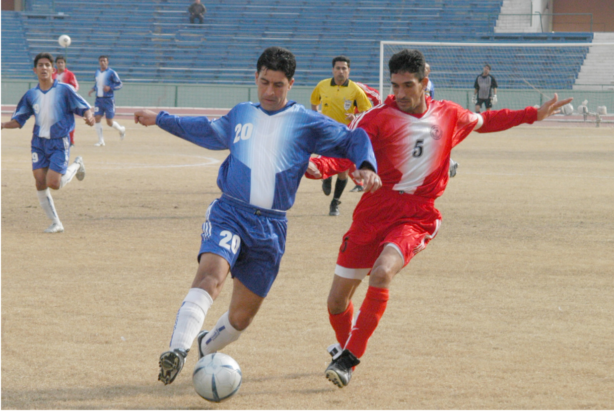
قطار دوري بغداد ينطلق الخميس المقبل

او غدا واقتنع الجميع بالمباريات وهنا تقدم ممثل نادي العدالة بطلب من اجل تأجيل مباراته الاولى بسبب ان اغلب لاعبيه من الطلبة ويصادف يوم ١٥ شباط ايامهم في امتحاناتهم ورفض طلبه لان الاتحاد لا يستطيع تأجيل المباريات الا في حالة وجود اكثر من ثلاثة لاعبين ضمن المنتخب الوطني