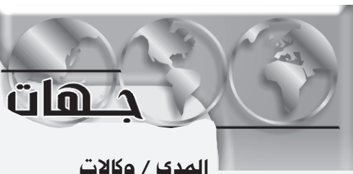
المدى / وكالات

وافقت كوريا الشمالية أمس بعد مفاوضات طويلة استمرت أكثر من ١٦ ساعة على تفكيك برنامجها النووي مقابل حصولها على مساعدات في قطاع الطاقة، ووقعت اتفاقية تم التوصل إليها في ساعات الصباح الأولى بين كوريا الشمالية من جهة والمفاوضين (كوريا الجنوبية، اليابان، الصين، روسيا، والولايات المتحدة) من جهة أخرى يوم أمس. واعلن مسؤول كوري جنوبي ان كوريا الشمالية تعهدت أمس البدء باغلاق منشآتها النووية وعلى الاخص مفاعلها الرئيسي، بموجب اتفاق وقع في المحادثات السداسية في بكين. وتحدثت المفاوضات الصينية وو داوي عن اتفاق من سبع نقاط تم التوصل اليه بعد مفاوضات سداسية استمرت ستة ايام بين الكوريتين والصين والولايات