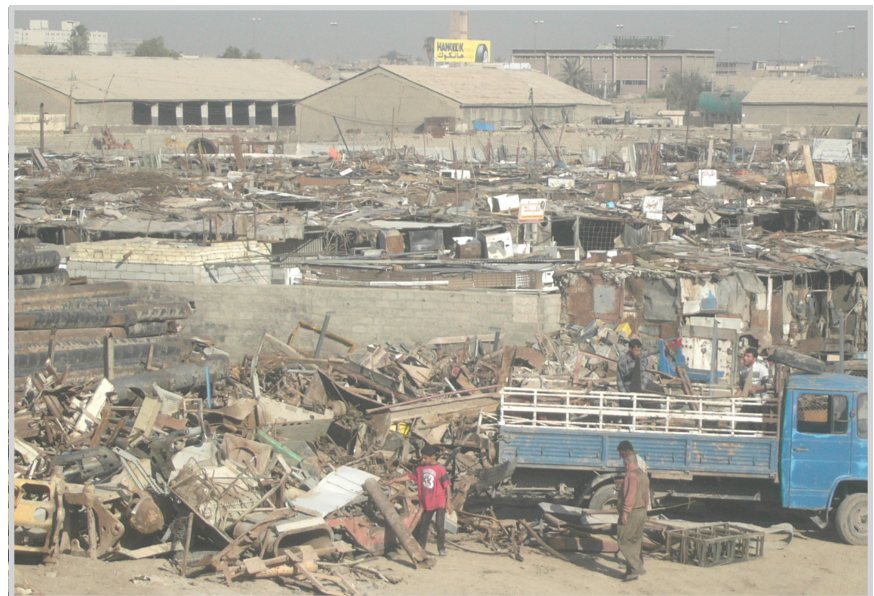
لمن كل هذا الحديد

المستشار الاعلامي لوزير العمل والشؤون الاجتماعية الشركة العامة للاتصالات والبريد