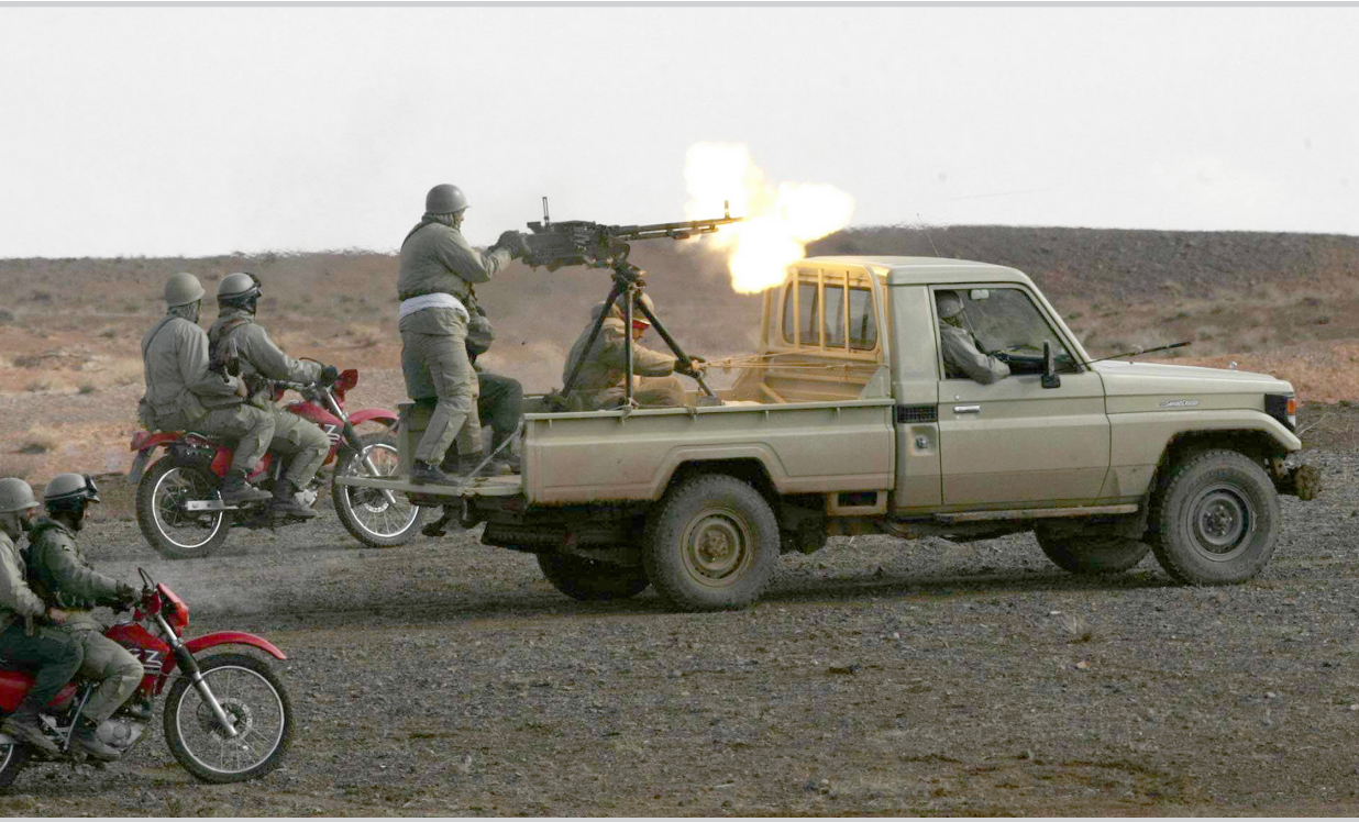
الحرس الثوري الإيراني يقوم بمناورات عسكرية

وازاء هذا الوضع، قال الاميرال واشنطن قررت "ان تدعم بقوة