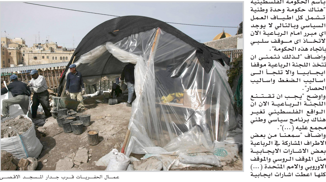
عمال الحفريات قرب جدار المسجد الأقصى

و قالت ليفني لاداعة الجيش الاسرائيلي "من المهم ان تواصل المجموعة الدولية احترام هذه الشروط غير القابلة للتفاوض". و اضافت ان "اسرائيل من جهتها لن تجري أي مفاوضات حول هذه الشروط وأمل في الا يقدم أحد تنازلاً حول هذه المسألة".