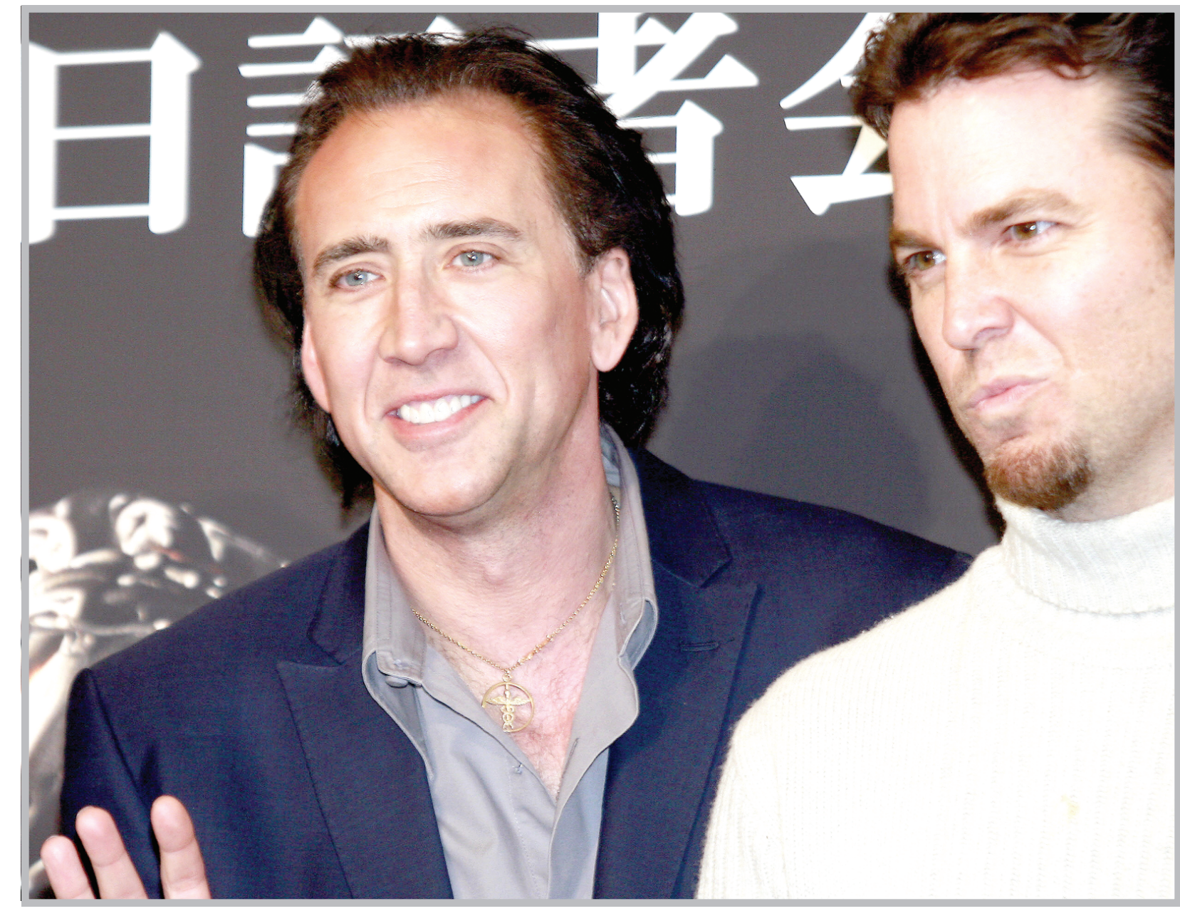
الممثل نيكولاس كيج مع المخرج مارك ستيفن في أثناء مؤتمر صحفي في طوكيو قبل عرض فيلمه الجديد (راكب الشبح)

قالت محاميتا طرقي النزاع بشأن جثمان نجمة الاثارة الامريكية انا نيكول سميث يوم الخميس انه سيوارى الثرى في جزر البهاما الى جانب جثمان ابنها المدفون هناك. وكان لاري سيدلين قاضي محكمة جنوب فلوريدا قد وضع في وقت سابق جثمان سميث -الذي بدأ يتحلل سريعاً بعد أسبوعين فقط من وفاتها المفاجئة- تحت رعاية حارس في فندق بفلوريدا- تحت رعاية حارس في عينته المحكمة وصيا على طفلتها البالغ عمرها خمسة أشهر. وقال هوارد شتيرن محامي سميث منذ فترة طويلة ورفيقها والذي خاض معركة ليدفن جثمانها الى جانب ابنها دنيايل الذي توفي منذ خمسة أشهر عن ٢٠ عاماً ودفن في جزر البهاما "انا في غاية الامتنان لان أمنيات انا نيكول ستتحقق". وحين سئل لتأكيد ان كان ذلك يعني ان الجائزة ستقام في ناساو قالت كريستا بارث محامية شتيرن وديبرا اوبري محامية لاري بيركهيد والصدى السابق لمصيفين امام محكمة فورت لودرديل حيث أمضى شتيرن وبيركهيد وفيرجي ارثر والدة سميث ستة أيام في معركة قضائية حول الجثمان فهما لا تستطيعان الادلاء بأي تفاصيل بشأن الجنازة الا انهما تأملان ان تكون خاصة.