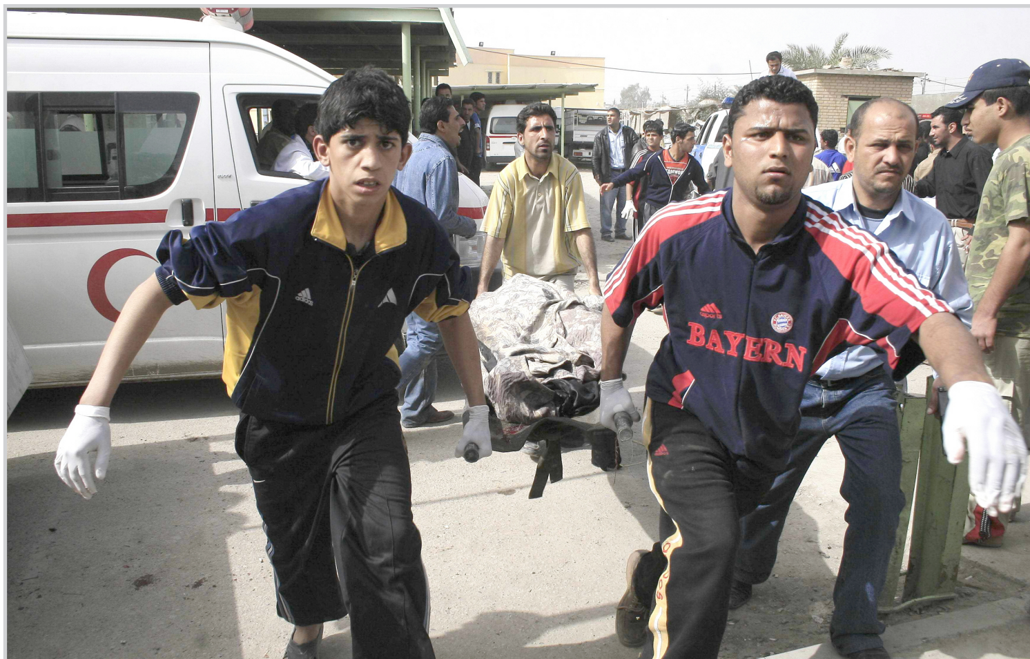
مسفون يهرعون لإنقاذ الجرحى والمصابين.. بغداد / أمس

من ثلاثين من بينهم ١٥ طالبة، ويبعد مبنى الكلية بضعة كيلومترات عن حرم جامعة المستنصرية.