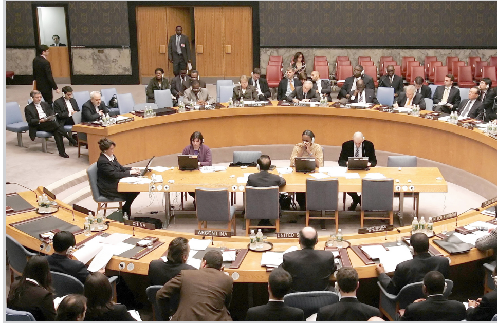
جلسة سابقة لمجلس الأمن

عدم نشر اسمه إن الرئيس أحمدى نجدان سيتوجه إلى السعودية اليوم السبت ويغادرها يوم غد الأحد بعد أن يجري محادثات تشمل قضايا إقليمية. ولم يخض في تفاصيل أخرى. ويستبعد المراقبون أن تسهم الزيارة في تجاوز أي من الخلافات القائمة بين الرياض وطهران، ولا سيما فيما يتعلق بموقف البلدين من التطورات في لبنان والعراق، وسياسة البلدين تجاه الولايات المتحدة.