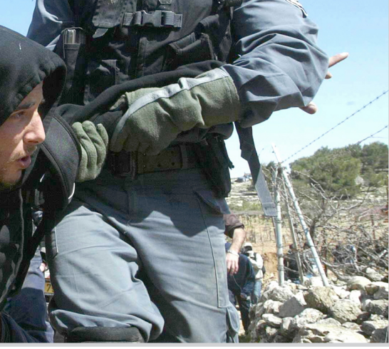
الشرطة الإسرائيلية تعقل أحد المتظاهرين الفلسطينيين