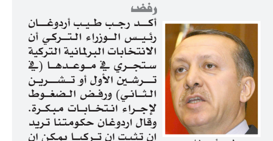
رجب طيب أردوغان

أعلن السيناتور جون ماكين، عضو مجلس الشيوخ الأمريكي عن ولاية أريزونا، أنه سيخوض المنافسة للفوز بترشيح الحزب الجمهوري، لخوض انتخابات الرئاسة المقبلة، المقرر إجراؤها في تشرين الثاني من العام ٢٠٠٨. وفي حالة إعلان ماكين رسمياً خوض انتخابات الرئاسة، فإنه سيعضد بذلك إلى عدد كبير من المرشحين في الحزب الجمهوري، يأتي في مقدمتهم حاكم مدينة نيويورك روديولف جولياني الإيطالي الأصل.