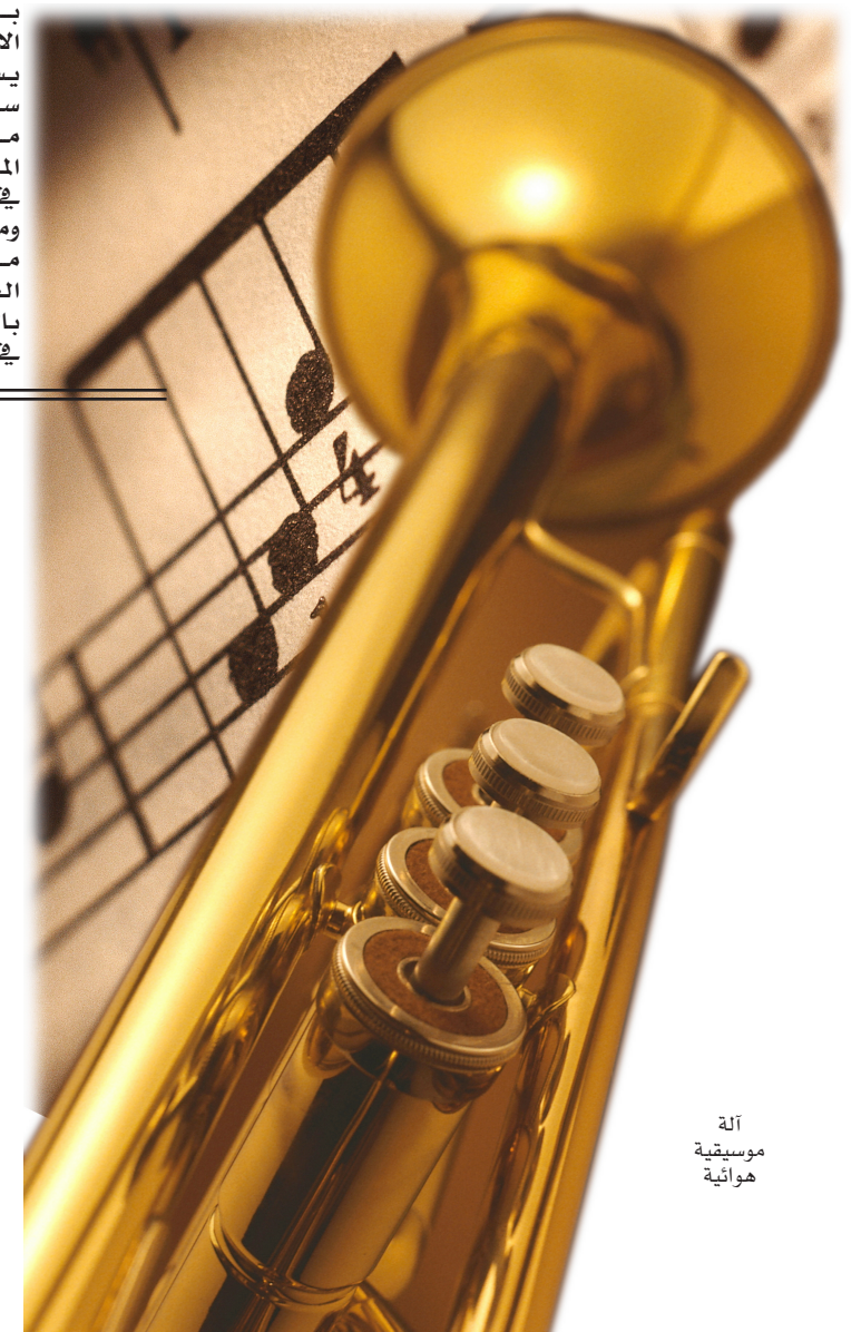
آلة موسيقية هوائية