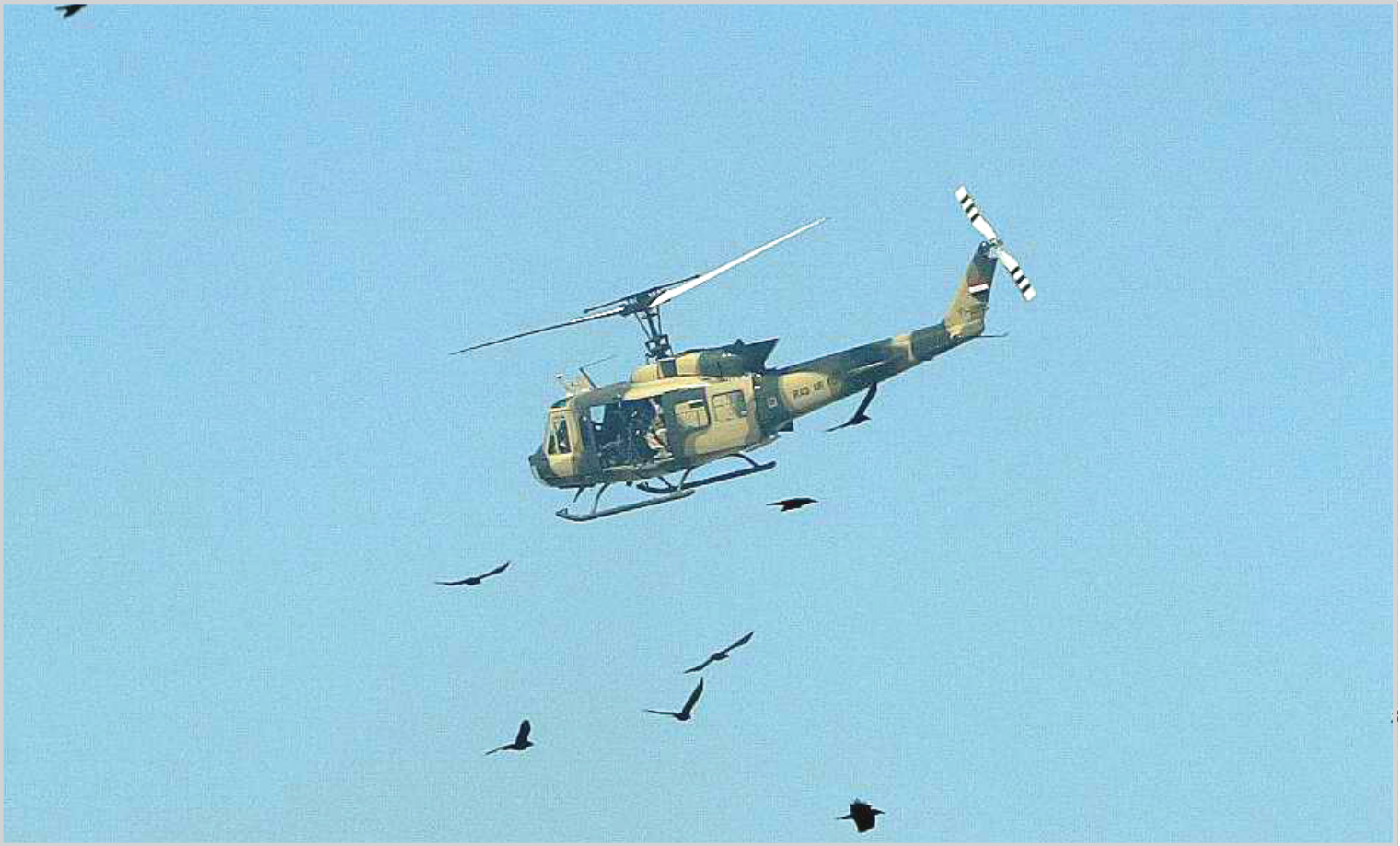
طائرة تابعة للقوة الجوية العراقية. بغداد ٢٠٠٧/٣/٣