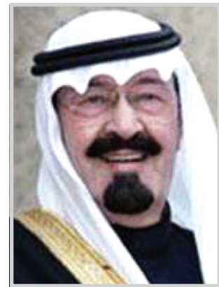
الملك عبد الله

الاسلامى وتوسيع العلاقات الثنائية والوضع في الشرق