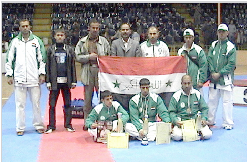
رئيس الوفد يتوسط لاعبي المنتخب الابطال بعد ختام البطولة

ضعف الاعداد وهبوط مستوى الفرق العراقية التي تنصدر لألحة الترتيب بين المنتخبات الايرانية والسابعة يومي ٨ و٩ من هذا الشهر ضمن خطة الاتحاد في تكثيف منهاج استعداده لبطولة العرب الثالثة التي ستقام في تونس خلال شهر ايار المقبل ونعول على ابطالنا في تكرار انجازاتهم في هذه البطولة التي سبق ان حققنا نتائج رائعة فيها في النسختين تونس ولبنان الماضيتين.