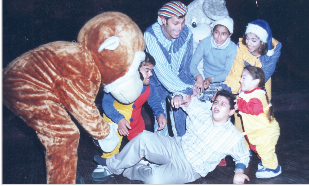
من مسرحية (الطيطيون) من مسرحية (الطيطيون)