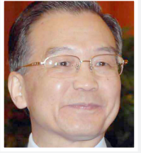
ون جيا باو

انتقد رئيس الوزراء الصيني ون جيا باو أمس الاثنين المسؤولين في الصين الأمر الذي أثار كما قال "سخطا كبيرا لدى الشعب". وقال أمام حوالي ثلاثة آلاف مندوب في اليوم الأول من الدورة السنوية للجمعية الوطنية الشعبية (البرلمان) في بكين "من الملاحظ ان هناك مظاهر بنخ وترف في بعض مراكز السلطة المحلية والوزارات والمؤسسات وهناك ميل الى الترف والى التبذير في ادارة الاموال العامة".