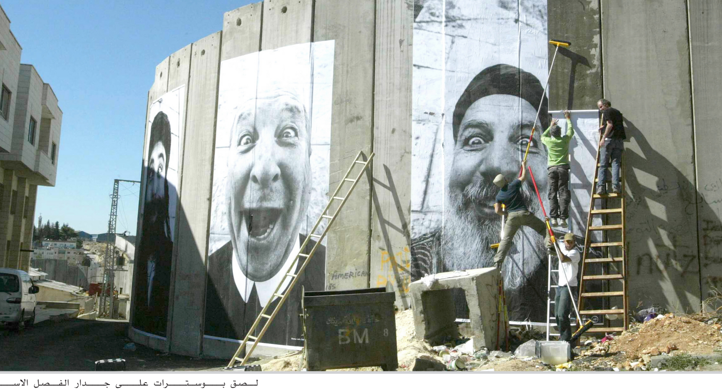
لصق بوسترات على جدار الفصل الاسرائيلي

تايه / وويترز صعد الرئيس التايواني شين شوي بيان من لهجته بشأن الاستقلال عن الصين قائلا انه يتعين على تايوان السعي الى الاستقلال وتغيير لقبها الرسمي في خطوة من المؤكد أن تخير غضب الصين وقلق الولايات المتحدة حليف تايوان الرئيسي. وأكد شين من جديد ايضا هدفة بصياغة دستور جديد في احدث خطوة من جانبه لتكوين وحدة منفصلة عن الصين التي تطالب بالسيادة على تايوان كجزء منها وهددت بالحرب اذا أعلنت الاستقلال رسميا. وقال شين في كلمة خلال مأدبة