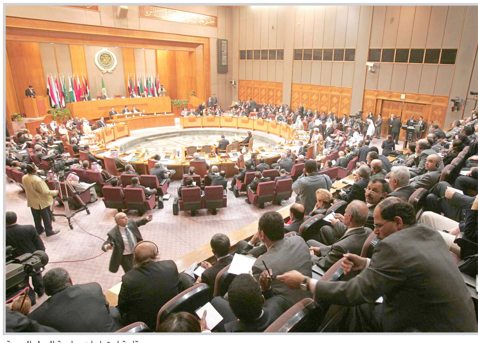
قاعة اجتماعات جامعة الدول العربية

بايران أو أي دولة أخرى... وانما بالملف النووي في الشرق الأوسط. إلى ذلك أعلن وزير الخارجية الليبي عبد الرحمن شلقم ان بلاده ستقاطع القمة العربية التي ستعقد في الرياض في الثامن والعشرين من آذار الجاري احتجاجا على نقلها من شرم الشيخ. وقال شلقم ان "هناك خلا في الاجراءات لان القرار الصادر عن اي قمة عربية لا تلغيه الا قمة اخرى ولذلك فان مقعد ليبيا سيكون شاغرا في القمة المقبلة".