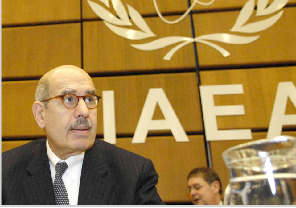
مدير الوكالة الدولية للطاقة الذرية محمد البرادعي

الداخلي (شين بت) المسؤول خصوصا عن حماية السفارات والقنصليات والمؤسسات الرسمية الإسرائيلية الاخرى في الخارج. اصدرت توجيهات بتعزيز اجراءات المراقبة والحذر. ووضحت ان هذه الاجراءات الاحتياطية اتخدت بعد اختفاء نائب سابق لوزير الدفاع الإيراني.